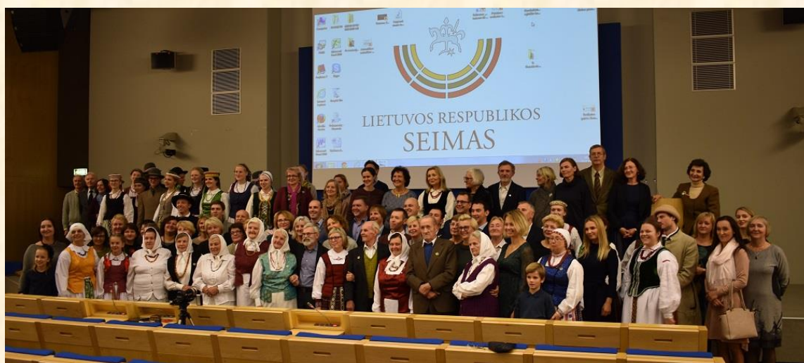
Konferencijos dalyviai pasidalijo prisiminimais ir problemomis.

Apie konferenciją siūlau paskaityti EKG publikacijoje internete „Spalio 24 d. vyko konferencija, skirta etnokultūrinio judėjimo ir žygeivystės 50-mečiui“: http://www.ekgt.lt/naujienos/spalio-24-d-vyko-konferencija-skirta-etnokulturinio-judejimo-ir-zygeivystes-50-meciui.html .