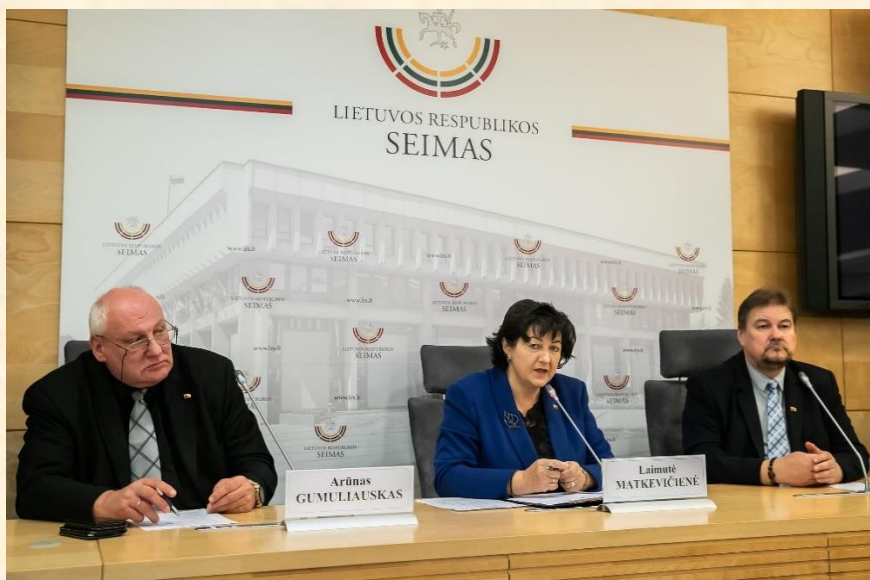
Spaudos konferencijoje Seime kartu su kolegomis.