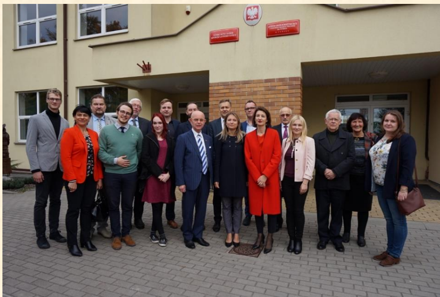
Visi delegacijos nariai įsitikinome, kad lietuviybė brangi Lenkijos lietuviams.

Vizito metu paaiškėjo nemažai problemų, o viena jų – Lietuvos Respublikos pilietybės klausimas, kuris ypač aktualus tiems etninių žemių lietuviams, kurie vyksta studijuoti į Lietuvą, o po studijų dažnai ir lieka gyventi Lietuvoje. Diskutuojant dėl pilietybės problemos, komisijos nariai adekvačiai suvokė Suvalkų krašte gyvenančių lietuvių situaciją. Šį ir kitus aktualius klausimus komisijos nariai vieningai sutarė neatidėliodami spręsti.