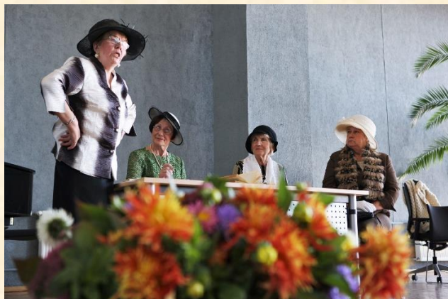
Šiaulių senjorai sužavėjo savo artistiniais gebėjimais.