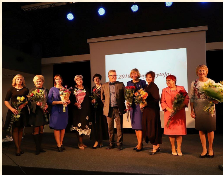
Geriausi 2018 metų Šiaulių miesto mokytojai.

Šiauliai parodė pavyzdį kitoms Lietuvos savivaldybėms. Apdovanojo 10 geriausiųjų šių metų pedagogų. O jeigu taip visos savivaldybės – būtų jau 600. Mūsų Mokytojai to verti.