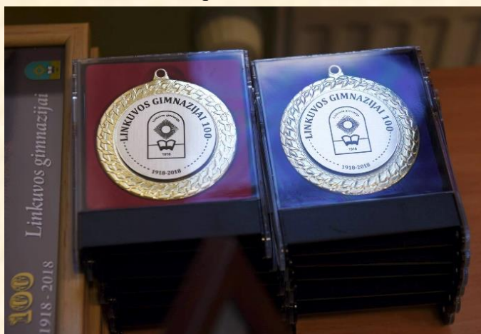
Linkuvos gimnazijai 100 metų.