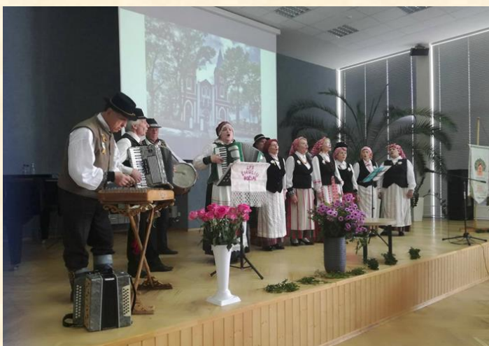
Koncertuoja kūrybingieji Šiaulių „Bočiai“.