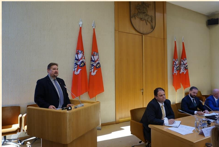
Skaitau pranešimą apie Pasaulio lietuvių metų minėjimo problemas.

Komisija po įtempto ir vaisingo darbo priėmė rezoliucijas, su kuriomis kviečiu susipažinti ir Jus: http://www.lrs.lt/sip/portal.show?p_r=9323&p_k=1 .