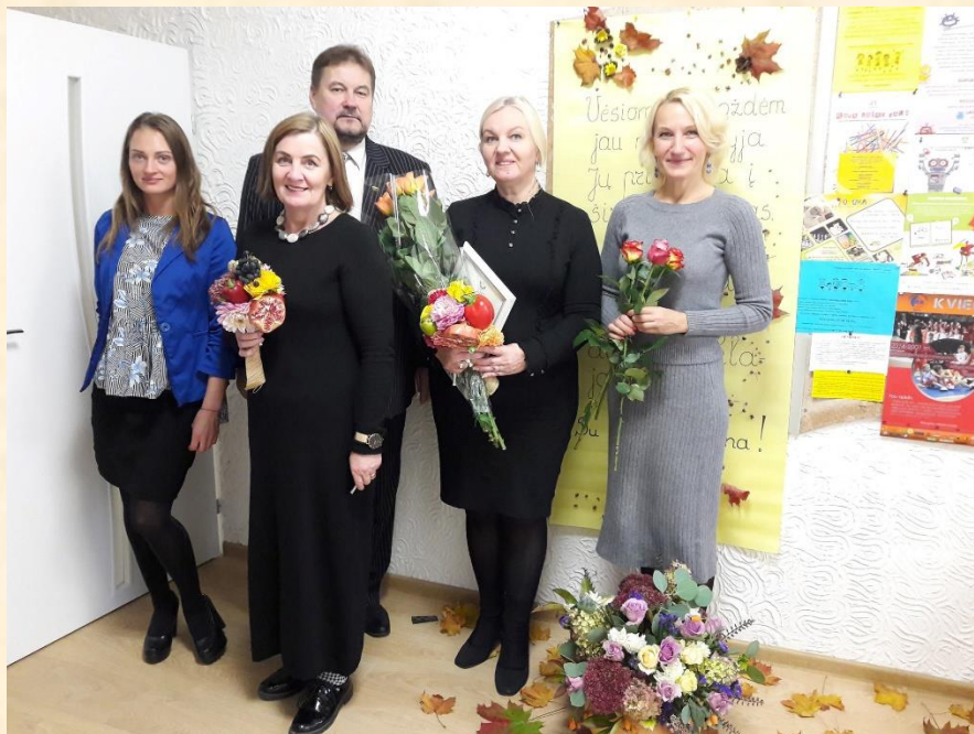
Pasveikinus direktorę ir „Gintarėlio“ kolektyvą.