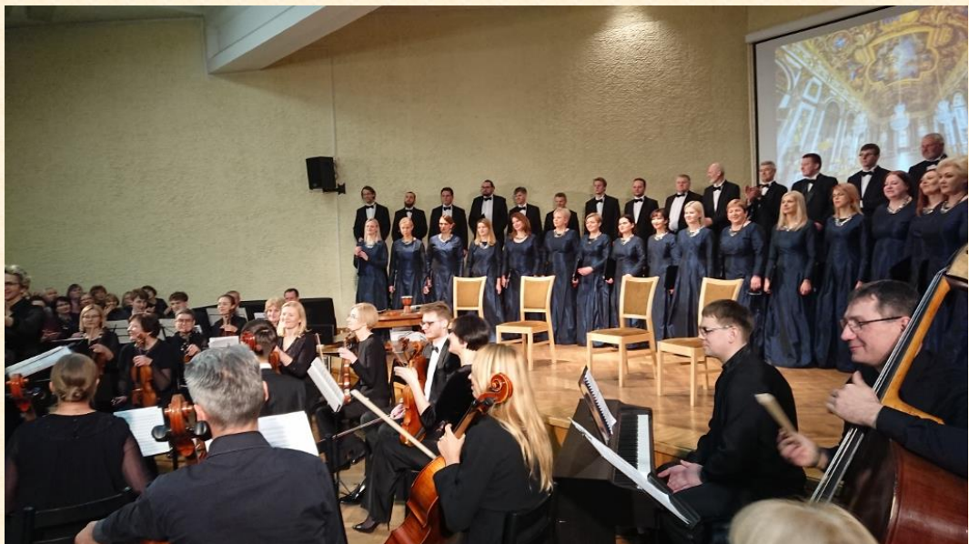
„Polifonijos“ dovana Šiauliams – klasikinės muzikos koncertas.