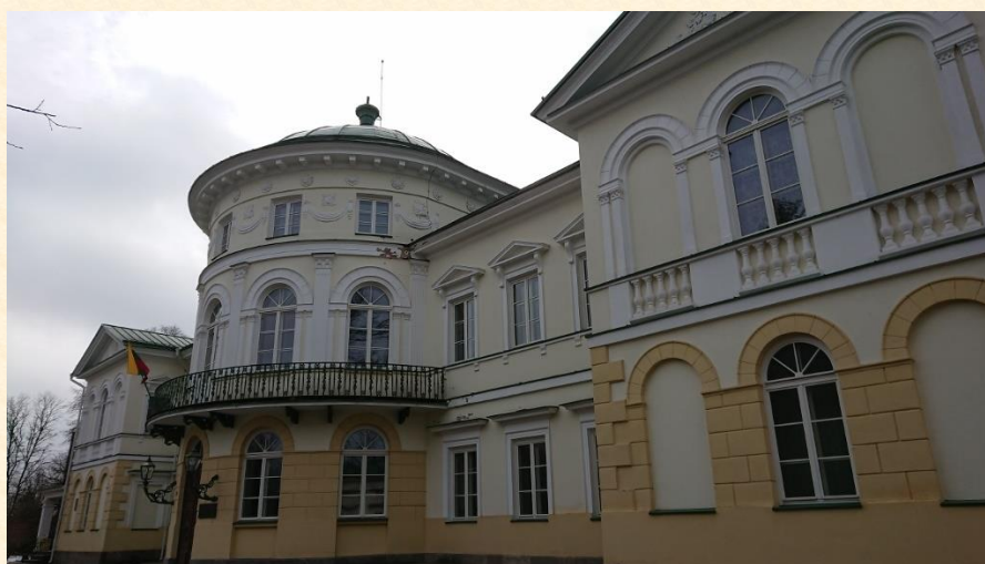
Baisogalos dvaras šiandien.

Šiuolaikinė Baisogala, jos bendruomenė, vertybės ir tradicijos atskleidžiamos sataner007 vaizdo įrašė „Baisogala-Baisogalos mstl. šventė 2017-06-09“, prieiga per internetą: https://www.youtube.com/watch?v=ID-om5mnRX0 .