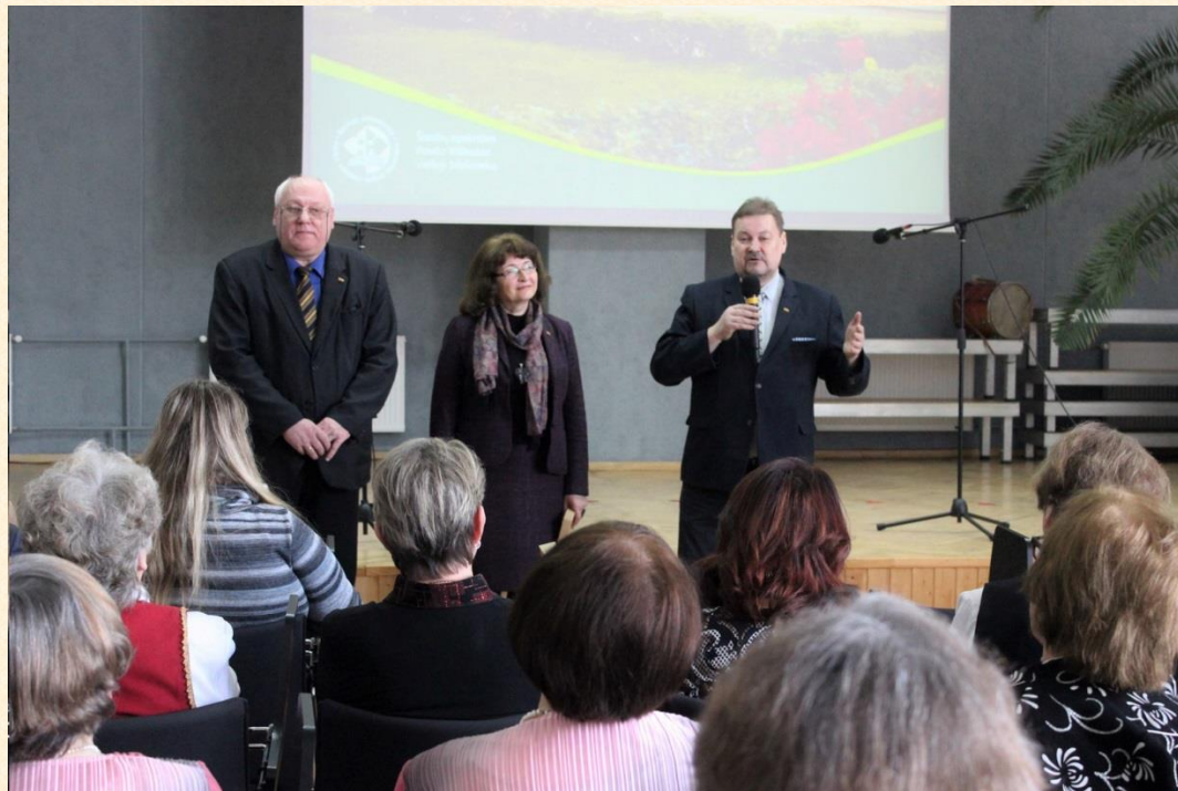
Šventėje vyrafo istorijos ir šiltų sveikinimų dvasia.