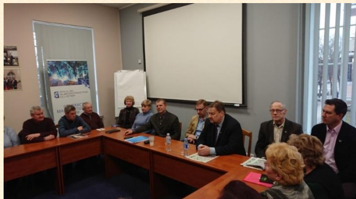
Susitikime išsakyta daug Šiaulių miesto problemų.

Tai ne vienintelis susitikimas su Šiaulių miesto bendruomene prieš artėjančius savivaldos rinkimus. Jų buvo daug, tačiau įsiminė vienas bendras bruožas – šiauliečiams rūpi, kaip gyvens miestas artimiausius ketverius metus, kas jam vadovaus, kas dirbs miesto taryboje.