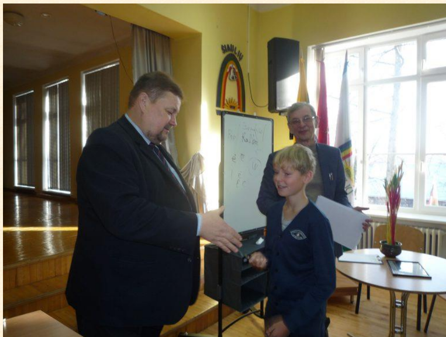
Susitikime įsitikinau, kad mokiniai vertina lietuvių kalbą.

2019 m. vasario 28 d. – Lietuvių kalbos dienų renginyje Šiaulių Vinco Kudirkos progimnazijoje. Smagu buvo po ilgos pertraukos vesti 5–8 klasių mokiniams pamoką apie lietuvių kalbos svarbą, būtinybę ją išsaugoti globalėjančiame pasaulyje. Kalbėjau apie tai, kad neišsiversime ir be svetimų tarptautinių žodžių, bet privalome ir saugoti gimtąjį lietuvišką žodį, vartoti lietuviškus atitikmenis, kai tai įmanoma, nes lietuvių kalba yra labai sena, kad tai yra didžiulis mūsų tautos turtas.