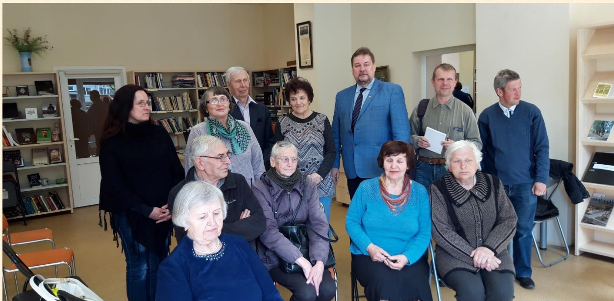
Su pokalbio dalyviais Lieporių bibliotekoje.

Aš akcentavau: „KAŲ iš(si)rinksime, TAS ir bus Lietuvos Prezidentas, KAIP pasakysime, TAIP ir bus nuspręsta dėl pilietybės išsaugojimo, KAIP pasakysite, TAIP ir dirbs ateityje LR Seimas – tiek pat asmenų, ar sumažėjęs. Jūsų valia, mieli tautiečiai, bendrapiliečiai.“ Štai apie ką tąsyk kalbėjomės su Lieporių bendruomene.