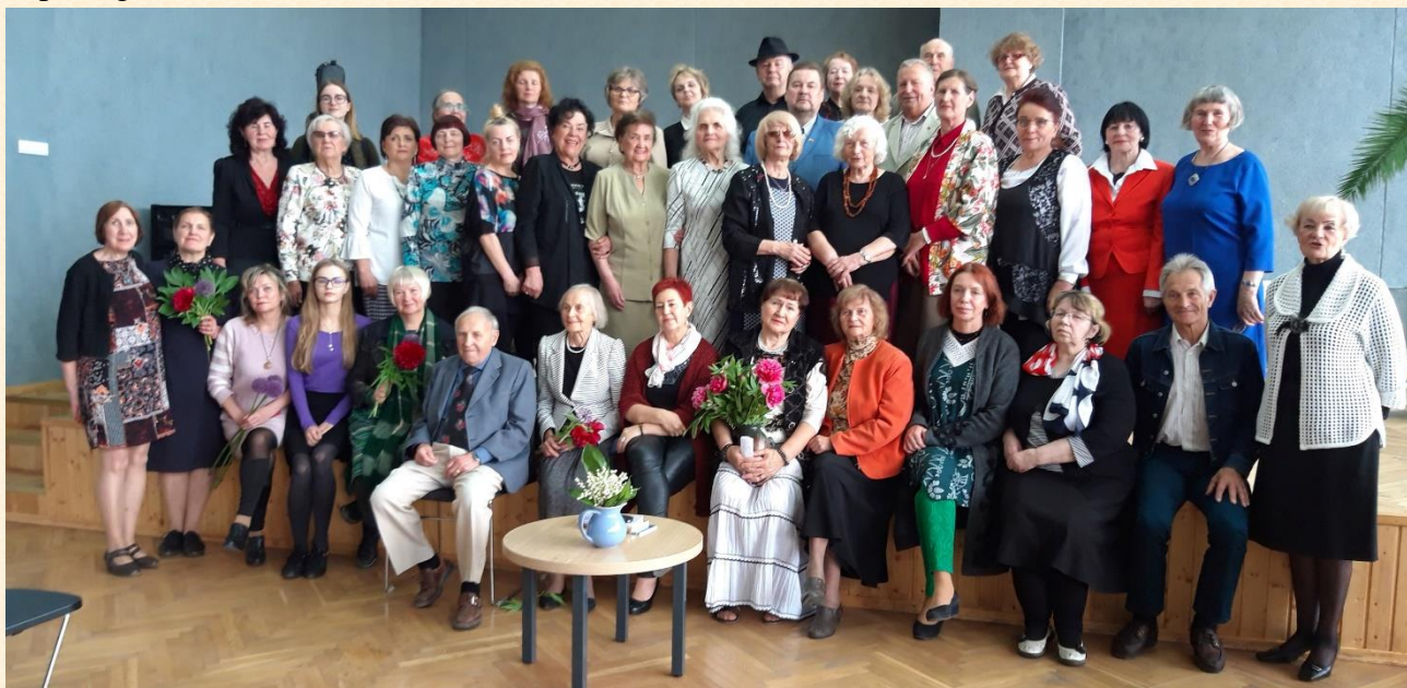
Poezijos mylėtojai susirinko ir Šiauliuose.

2019 m. gegužės 26 d. dalyvavau „Šiaulių poezijos pavasario“ šventėje Šiaulių apskrities Povilo Višinskio viešojoje bibliotekoje. Savo kūrybą skaitė, bendryste per kūrybą džiaugėsi susirinkę Šiaulių, Pakruojo, Kelmės, Panevėžio rajono literatai. Jie nepretenduoja į Poezijos Olimpą, bet savo gyvenimo dalį skiria poetinei kūrybai ir kultūrai apskritai. Todėl ir šventėje dalyvavę literatai pritartų Kultūros ministro Mindaugo Kvietkausko minčiai, kad „poezija yra nepaneigiama aukso valiuta, kuri ir toliau vertinama, vertinamas tikrasis literatūros svoris“.