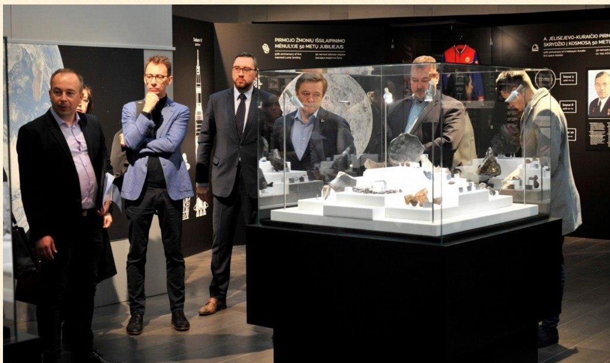
Lietuvos etnokosmologijos muziejus rengiasi išnaudoti daug naujų veiklos galimybių.

Nutarta kreiptis į Lietuvos Respublikos kultūros ministeriją ir prašyti parengti ir Kultūros komitetui pateikti apibendrintą informaciją (sąvadą, planą) apie kultūros įstaigų poreikius, problemas ir galimus sprendimus.