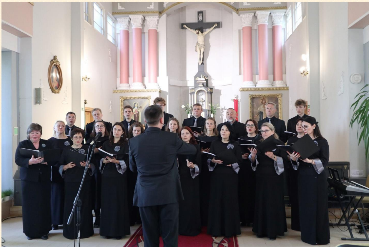
Liudvinavas – kultūros erdvė.

Šiuolaikinis Liudvinavas atskleidžiamas „Liudvinavo kultūros“ vaizdo įrašė „Liudvinavas 2019 mažoji Lietuvos kultūros sostinė“, prieiga per internetą: https://www.facebook.com/153787217986201/videos/1020734478114422/ .