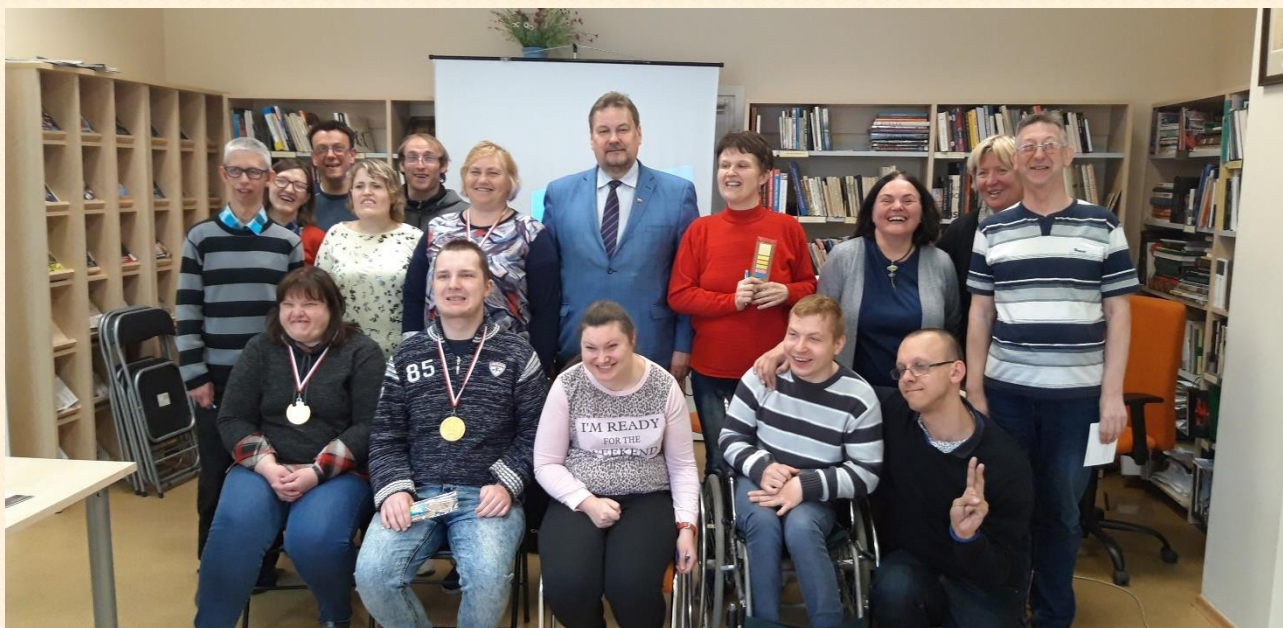
Susitikime netrūko ir geros nuotaikos, ir žinių, ir klausimų.

valstybių sandūroje. Pateikti ir praktiški klausimai: ką reikėtų žinoti svečiuojantis ES šalyje, kai susergama, norima paskambinti į namus ar nusipirkta nekokybiškas elektroninis prietaisas.