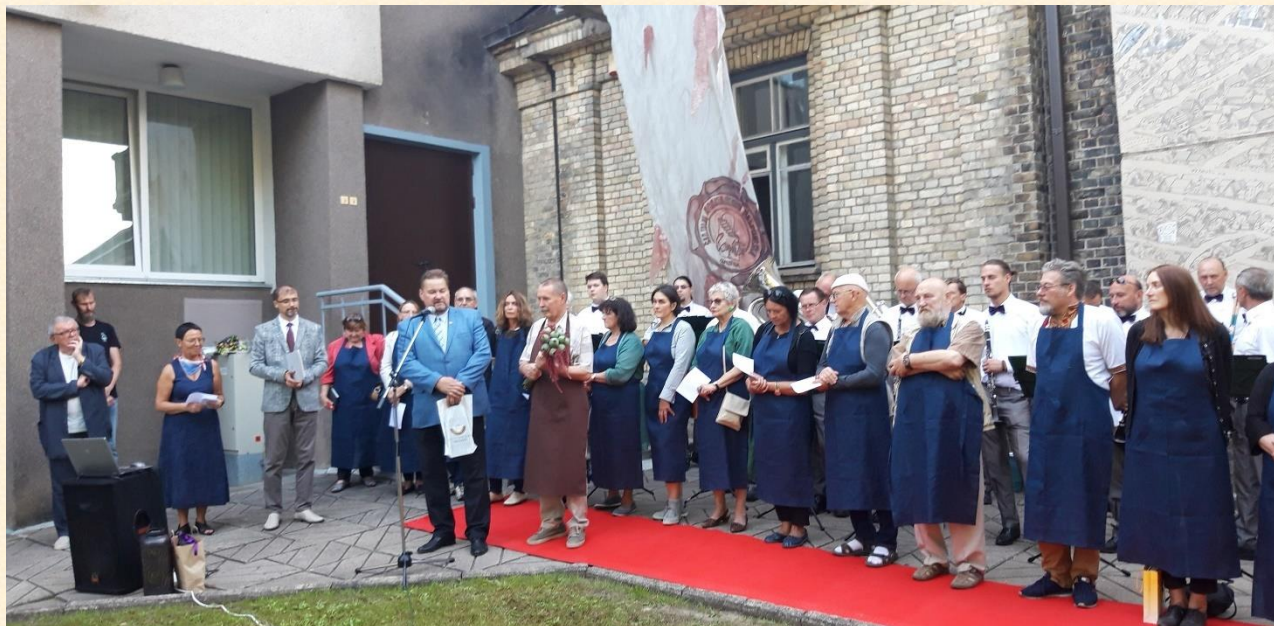
Sveikinu tarptautinio festivalio dalyvius.

Vilniaus Užupis pasikabino lentelę, kad draugauja ir pritaria Paryžiaus Monmartro dvasiai. Šiaulių Žemaitės gatvės Monmartras pasirinko kelių dienų laisvą skrydį (su prasmingomis veiklomis ir išvykomis į Joniškį, Žagarę) su plenero virtuve, performansais, šviesos žaismu, muzika, dainomis, lietuviškais ir prancūziškais. O greta pleveno Žibunto Mikšio, arsininkų dvasia. Įdomu, ką galvoja P. Bugailiškis iš savo sodo šešėlio?