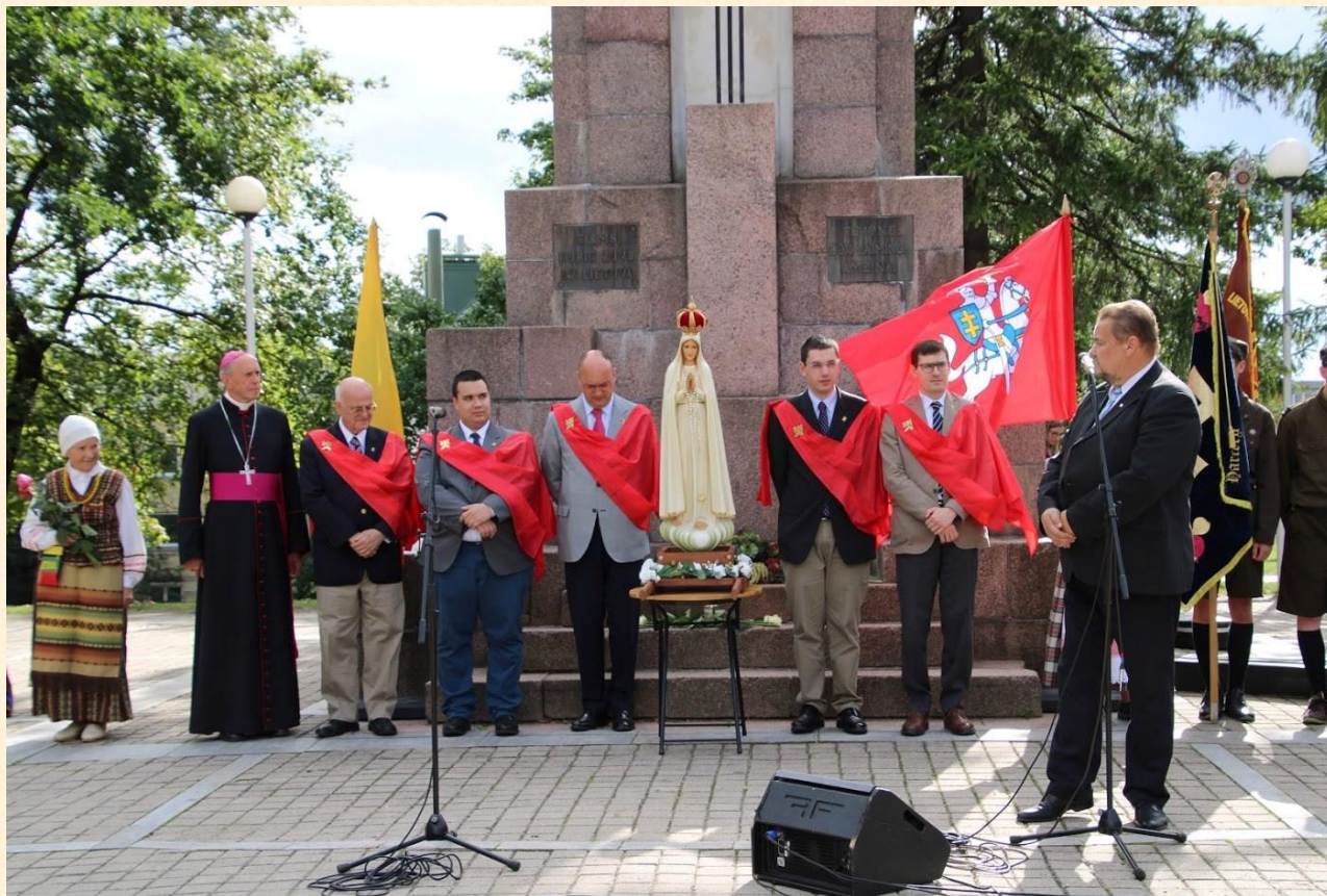
Kreipiuosi į katalikiškas vertybes puoselėjančias asmenybes ir organizacijas.