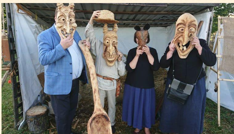
Žemaičių ličynos primena senus laikus ir gyvąją tradiciją.

2019 m. rugsėjo 20 d. dalyvavau Jono Prano Aleksos tarptautinėje mokslinėje konferencijoje „Valstybės vizijos raida XXI amžiuje: tautinis ir tarptautinis kontekstas“, vykusioje Šiaulių universiteto bibliotekoje. Konferencija skirta Lietuvos mokslininkų sąjungos veiklos 30-mečiui ir prof. Jono Prano Aleksos 140-osioms gimimo metinėms.