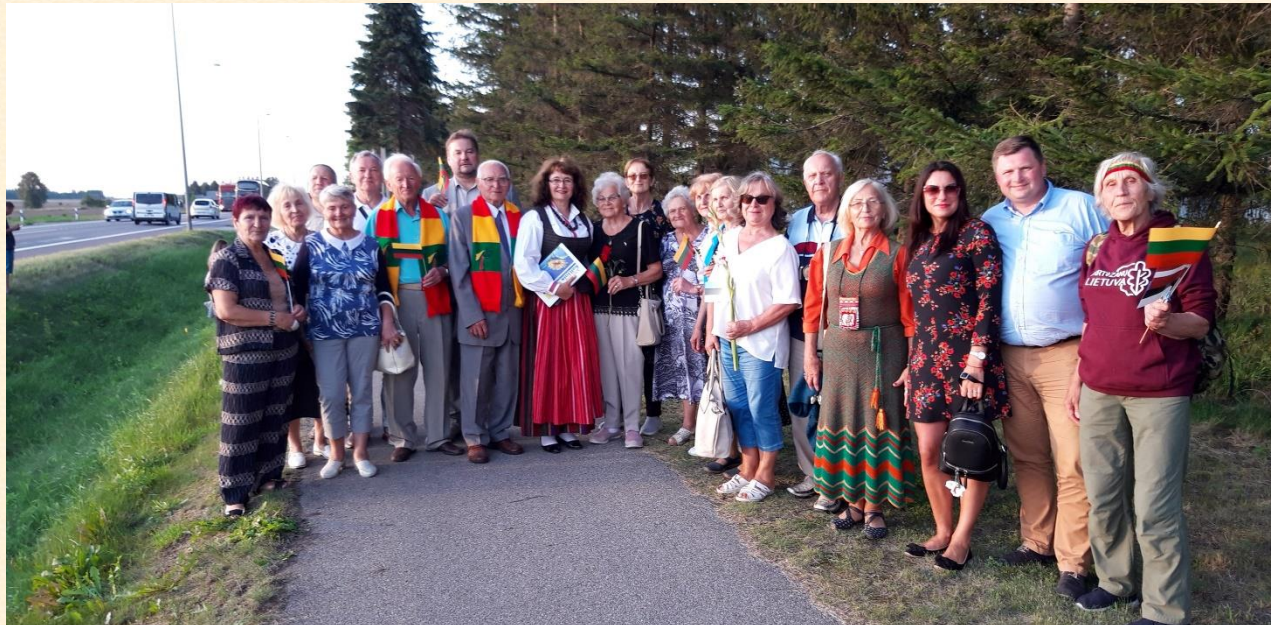
Su garbiais Lietuvos patriotais ir Baltijos kelio liudininkais iš Šiaulių.

Atmintiną dieną Latvijos-Lietuvos pasienyje ties Saločiais viena bendruomenė buvo visi – ir Prezidentas G. Nausėda, ir Latvijos Prezidentas E. Levitas, ir Šiaulių, Panevėžio, Pakruojo, Pasvalio žmonės. Juk Baltijos kelias – tai mes. Tą dieną ypač malonu buvo kelyje susitikti, pabendrauti su mielais šiauliečiais, tų dienų liudininkais.