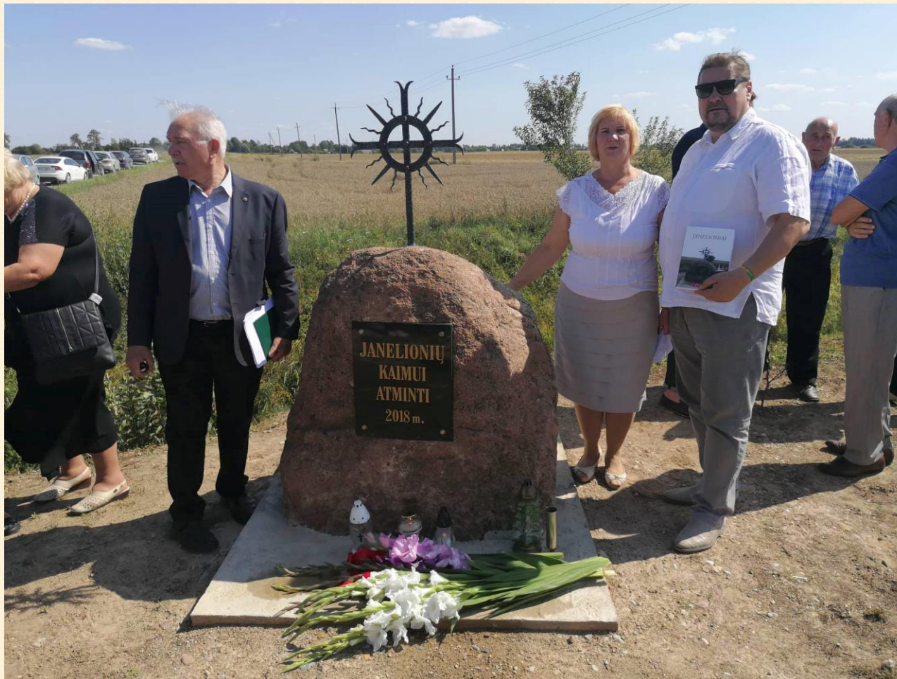
Prasmingai įamžintas Janelionių kaimo atminimas.