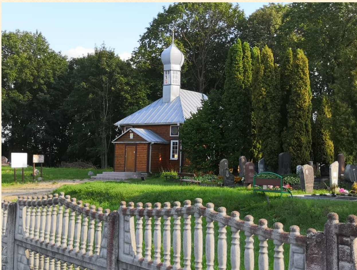
Nemėžio k. totorių kapinių mečetė.

Totorių bendruomenei šventovė grąžinta 1978 metais.