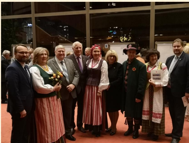
Žemaitijos metų minėjimo akimirka. L. Ubavičiaus nuotrauka.

2019 m. rugsėjo 24 d. – iškilmingame renginyje, skirtame Žemaitijos metams paminėti, vykusiame Lietuvos nacionaliniame operos ir baletų teatre. Gražų, vienijantį ir pasididžiavimo jausmą keliantį renginį inicijavo Lietuvos Respublikos Seimo laikinoji Žemaičių grupė ir Lietuvos Respublikos kultūros ministerija. Buvo malonu matyti ir girdėti kolektyvus iš Šiaulių krašto, kurie atskleidė dvasinį Žemaitijos grožį ir tapatybę.