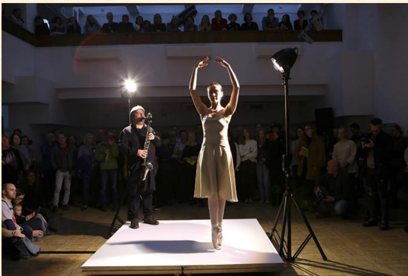
Festivalio atidarymo akimirka.