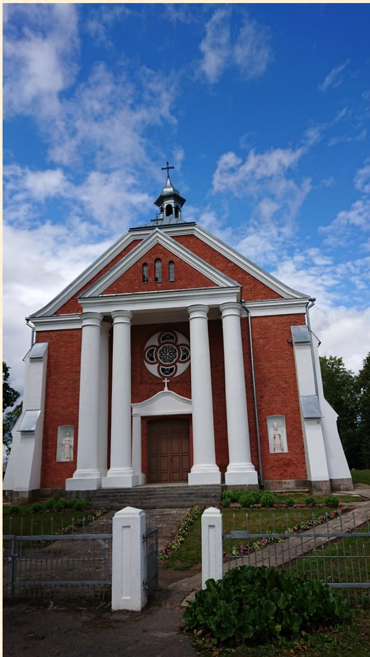
Vadžgirio Šv. Juozapo bažnyčia.

Veikia Vadžgirio kaimo istorijos muziejus (Vadžgirio kaimas, Šimkaičių seniūnija, Jurbarko rajonas). Muziejuje veikia ekspozicija, kuri supažindina su Vadžgirio kaimo istorija, vyksta kaimo ir mokyklos bendruomenės šventės, pamokos moksleiviams.