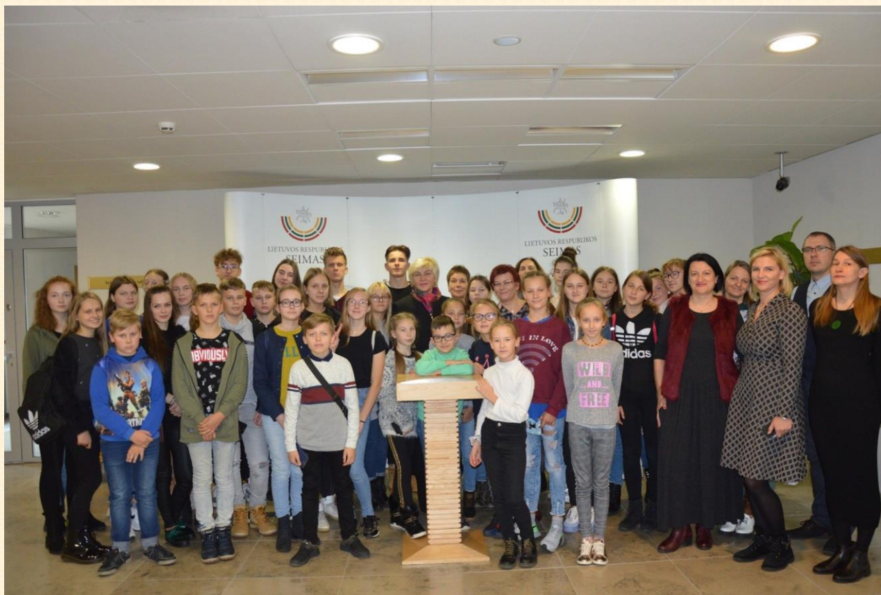
Skuodo meno mokyklos mokiniai ir pedagogai Seime.

Malonu ir prasminga, kad Skuodo talentingas jaunimas ir pedagogai Žemaitijos metais į LR Seimą atvežė dalį Žemaitijos. Visus žiūrovus skuodiškiai pavergė nuoširdumu ir savo talentu.