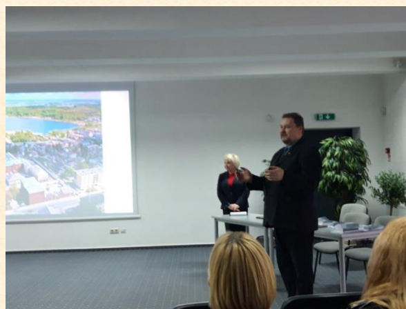
Sveikinu pareigūnus jų profesinės šventės proga.