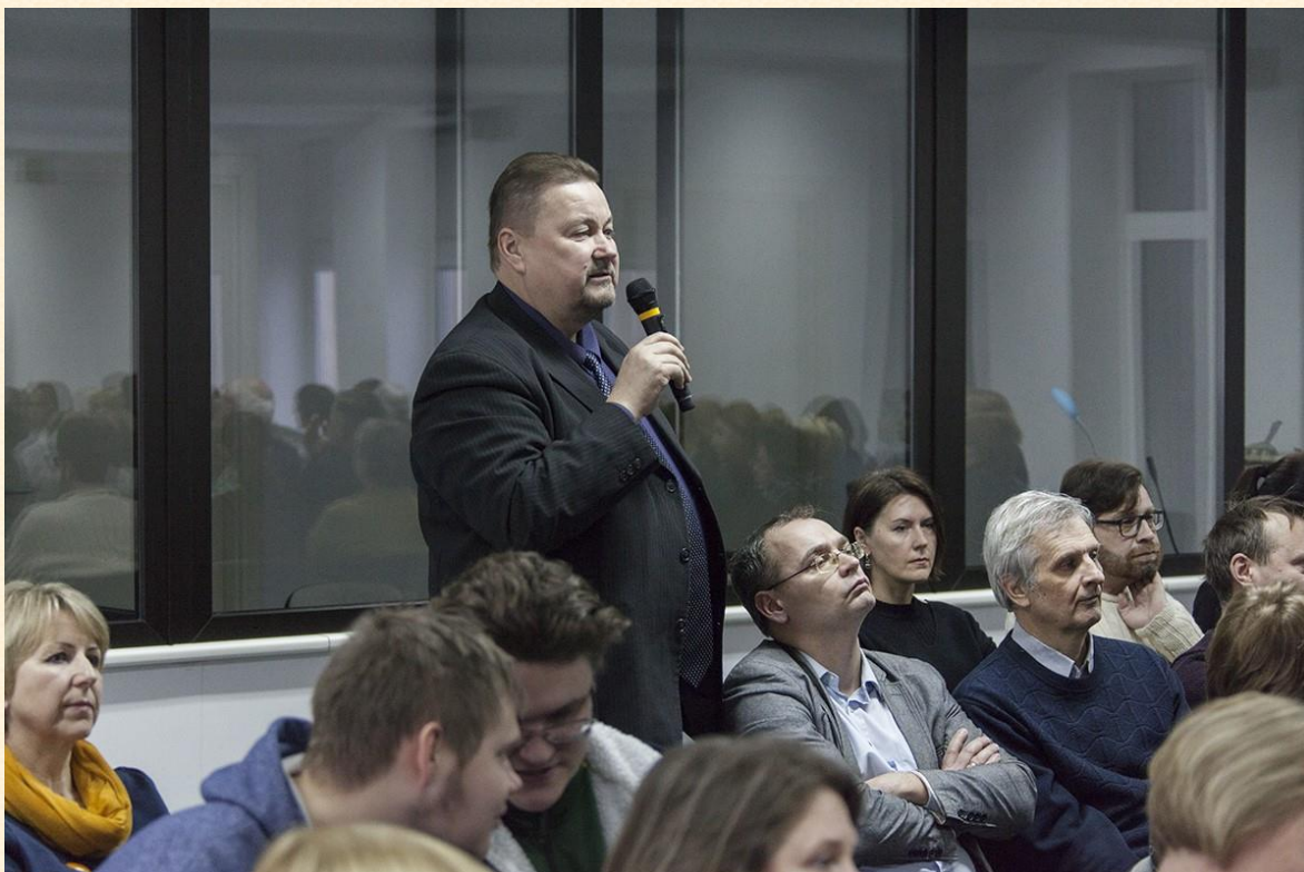
Susitikime buvo naudinga ir išklausti, ir paklausti.

Apie susitikimą siūlau paskaityti Zenono Ripinskio publikacijoje: „Šiaulių universiteto bendruomenei pristatytas VUŠA 2020–2024 metų raidos projektas“, prieiga per internetą: http://www.su.lt/index.php?option=com_content&view=article&id=22133:%C5%A1iauli%C5%B3-universiteto-bendruomenei-pristatytas-vu%C5%A1a-2020%E2%80%932024-met%C5%B3-raidos-projektas&catid=761&Itemid=5521&lang=lt .