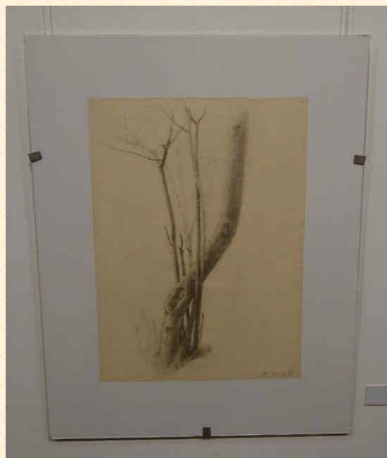
Algimanto Švėgždos kūriniai žavi ir šiuolaikinio meno mylėtojus. N. Brazausko nuotraukos.

2020 m. vasario 10 d. – Šiaulių universiteto bibliotekos salėje vykusiame Pataisos pareigūnų profesinės šventės ir Lietuvos bausmių vykdymo sistemos įkūrimo 101-ųjų metinių minėjime. Šiaulių tardymo izoliatoriaus (ŠTI) dirbančiuosius, pareigūnus sveikino politikai, miesto vadovai, teismų, statutinių organizacijų, savanoriškųjų krašto pajėgų vadovai ir atstovai, ŠTI socialiniai partneriai.