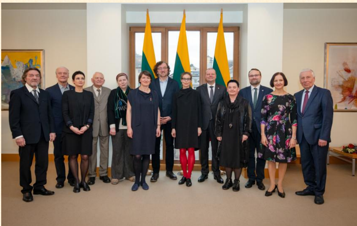
2020 metų Vyriausybės kultūros ir meno premijos laureatų pagerbimo ceremonija.

Renginio vaizdo įrašą ir laureatų mintis apie meną, kultūros lauką Jūs galite peržiūrėti ir išgirsti: https://www.facebook.com/LRVyriausybe/videos/540575999919192/ .