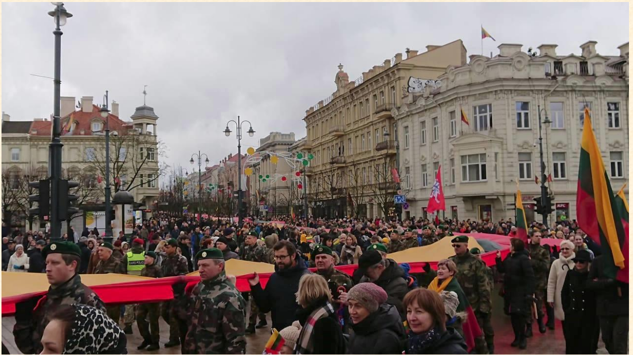
Lietuvos žmonės vertina laisvę ir nepriklausomybę.

2020 m. kovo 17 d. – Laisvės kovų ir valstybės istorinės atminties komisijos posėdyje. Jame svarstytas klausimas „Dėl Laisvės kovų ir valstybės istorinės atminties komisijos 2019 metų veiklos ataskaitos projekto“. Projektui buvo pritarta, nes komisija įgyvendino anksčiau išsikeltas veiklas, reagavo į piliečių pasiūlymus, pasinaudojo įstatymų leidybos iniciatyvos teise.