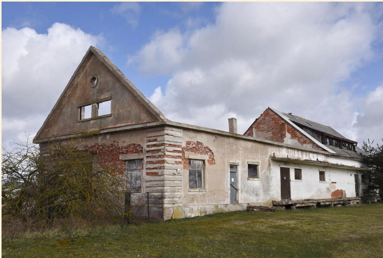
Kultūros vertybė Linkuvoje tik Kultūros vertybių registre?

Linkuvą vasaromis puošia darbščių linkuvių moterų sukurti „gėlių drugeliai“, kiti gyvieji puošybos elementai centre, parke prie gimnazijos, bet ypač žiemomis, kai miestas tuščias, kai gatves košia šiauriniai vėjai, tokie siurrealistiniai vaizdai, koks yra minėtas istorinis regioninės reikšmės pastatas, nepuošia nei miesto, nei valdžios. Lauksime tolimesnių veiksmų.