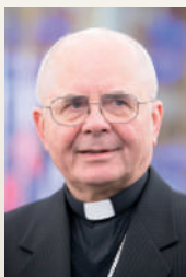
Sigitas Tamkevičius SJ (2013 m.)