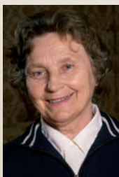
Nijolė Sadūnaitė (2017 m.)