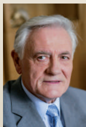
Valdas Adamkus (2016 m.)