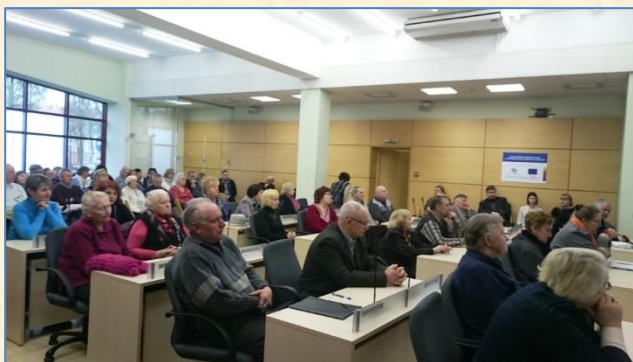
Susitikimas su vietos bendruomenėmis Šiauliuose