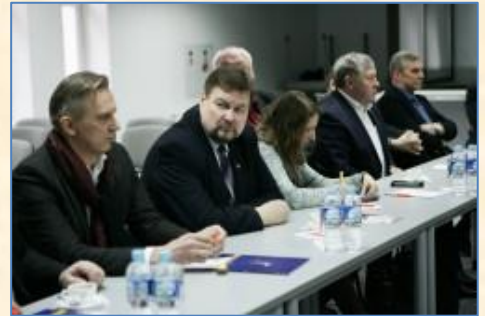
Diskusija dėl Šiaulių universiteto ateities