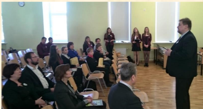
Konferencijoje Linkuvoje