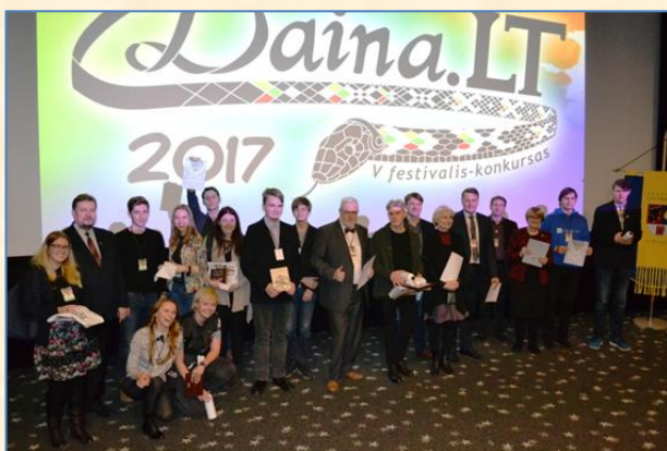
Konkurso laureatai ir organizatoriai, N. Brazausko nuotrauka.

2017 m. vasario 3 d. dalyvavau V respublikiniame moksleivių muzikos ir video festivalyje konkurse „Daina. LT 2017“, kurį organizavo VšĮ Šiaulių universiteto gimnazija. Finale varžėsi trylika moksleivių. Jie pateikė savitas liaudies dainos vizualizacijas. Konkurso rengėjai apdovanojo ne tik „Didžiojo prizo“ laimėtoją, bet ir skyrė nominacijas: „Jaučiu dainą“, „Girdžiu dainą“, „Matau dainą“ ir kt. Aš vertinu liaudies dainą, nes ji yra svarbi mūsų tautos