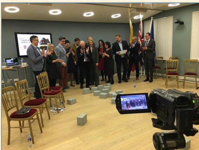
Akimirka iš debatų, svetainės www.tiesa.com nuotrauka.

2017 m. vasario 11 d. dalyvavau Londone vykusiuose debatuose „Sugrįžanti Lietuva: utopija ar realybė?“. Debatų metu buvo aptarta politinė situacija Jungtinėje Karalystėje, emigracijos mažinimo politika ir strategija Lietuvoje, ekonominės emigracijos priežastys ir virtualių darbo vietų