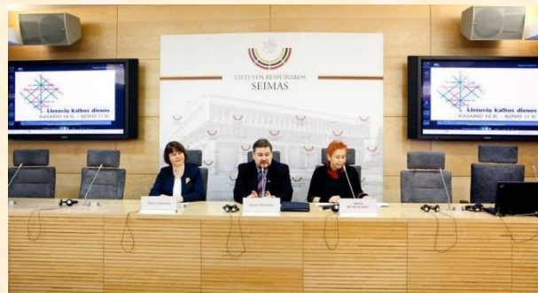
Spaudos konferencija

KULTŪROS METAIS Lietuvoje skambėtų ir sklistų švari, taisyklinga, neapkibusi anglizmais mūsų kalba. Juk ŠVARI KALBA – ŠVARI GALVA, juk KALBOJE VISŲ NAMAI, juk LIETUVIŲ KALBA – MŪSŲ TAUTOS ISTORIJA, MEILĖ MŪSŲ TĖVAMS IR SENELIAMS.