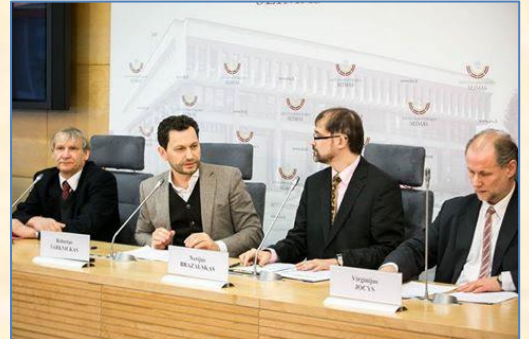
Nerijus Brazauskas konferencijoje.

Spaudos konferencijos vaizdo įrašą galite peržiūrėti: http://www.lrs.lt/sip/portal.show?p_r=15259&p_k=1&p_a=media_object_viewer&guid=34AB1001-64F3-40C0-804D-8FECAF42EAFD .