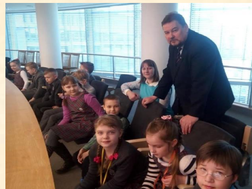
Seime susitinku su Šeškinės pagrindinės mokyklos mokiniais ir jų ugdytojais.

2017 m. balandžio 20 d. Seime maloniai susitikau ir pabendračiau su Lietuvos ateitimi – Vilniaus Šeškinės pagrindinės mokyklos antrokais ir jų mokytojais. Guvūs ir smalsūs vaikai domėjosi darbu Seime, išsakė įdomių minčių. Į klausimą, kokį įstatymą priimtų dėl mokinių atostogų ilginimo ar trumpinimo, antroka vieningai atsakė, kad atostogų trumpinti vasarą nereikia... Aš taip pat manau, kad pirmiausia reikia peržiūrėti ugdymo turinį, metodus ir egzaminų sistemą.