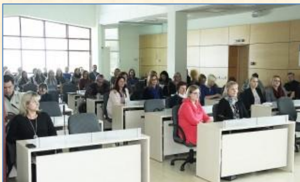
Projektu domėjosi įvairių sričių specialistai. Šiaulių miesto savivaldybės svetainės http://edem.siauliai.lt nuotrauka.