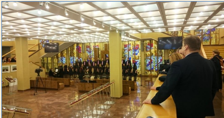
„Vitražo galerijoje“ skambėjo studentų balsai.

2017 m. balandžio 19 d. „Vitražo galerijoje“ vyko Šiaulių universiteto koncertas. Buvo malonu ir įspūdinga pasiklausyti Šiaulių universiteto Muzikos pedagogikos katedros mišriojo choro „Studium“ profesionaliai atliekamų kūrinių, pamatyti Socialinių, humanitarinių mokslų ir menų fakulteto Menų katedros absolventų darbų parodą. Meninė veikla visada buvo svarbi universitetui, ją būtina puoselėti ir tęsti.