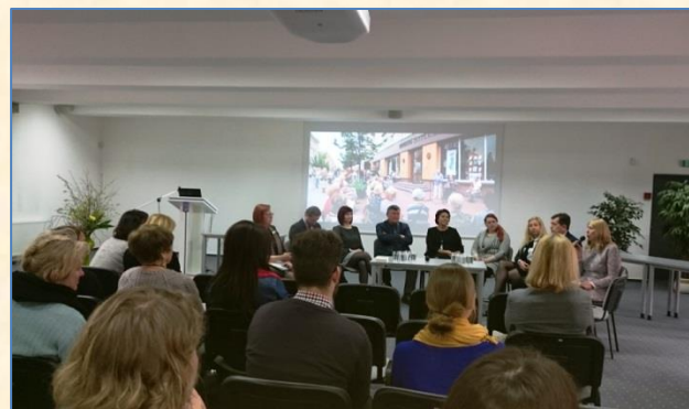
Šiaulių krašto turizmo forumas sulaukė didelio susidomėjimo.