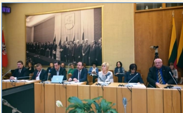
Posėdyje klausomės etnologijos dėstytojų argumentų.

2017 m. balandžio 19 d. dalyvavau bendrame Lietuvos Respublikos Seimo Kultūros ir Švietimo ir mokslo komiteto posėdyje, kuriame svarstėme Etninės kultūros globos tarybos, etnologijos dėstytojų siūlymus dėl etnologijos ir folkloristikos studijų krypties. Kultūros komiteto posėdyje aptarėme darnaus turizmo plėtros šalies regionuose klausimą, iš klausėme Žurnalistų etikos inspektoriaus tarnybos 2016 metų veiklos ataskaitą. Posėdyje pasisakė etnologijos mokslininkai, Švietimo ir mokslo ministrė Jurgita Petrauskienė ir viceministras dr. Giedrius Viliūnas, kolegos Seime; buvo akcentuotas etninės kultūros mokymo mokyklose poreikis, vyko diskusijos. Posėdyje siūliau tiesiog sugrąžinti Etnologijos studijas į Studijų kryptių sąrašą, bet minėto viceministro