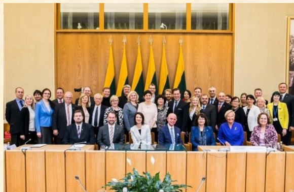
Seimo ir Pasaulio lietuvių bendruomenės komisijos nariai.

Naujienlaiškis neleidžia paminėti visų posėdžiuose išsakytų dalykų, dėl to kviečiu Jus atidžiai peržiūrėti vaizdo įrašus oficialiame Lietuvos Respublikos Seimo „YouTube“ kanale: https://www.youtube.com/user/LTSeimastiesiogiai .