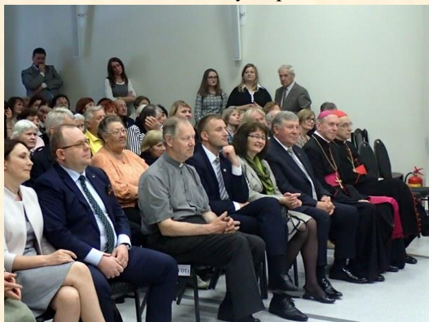
Šiaulių vyskupijos 20-mečio šventėje.