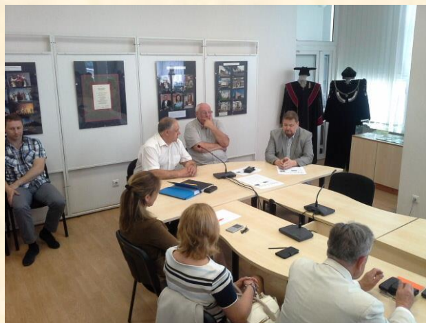
Diskutuojame dėl Šiaulių universiteto ateities.

2017 m. birželio 19 d. susitikau su Šiaulių universiteto vadovybe Šiaulių universitete. Šio susitikimo tema buvo „Šiaulių universitetas Lietuvos universitetų konsolidacijos procese“. Aptarėme Šiaulių universiteto situaciją, jo vietą optimizuotame universitetų tinkle, diskutavome.