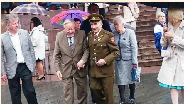
Partizanų vado Juozo Vitkaus-Kazimieraičio atminimą pagerbė garbūs asmenys.