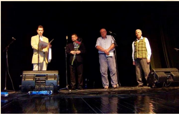
Šiaulių „Bočiai“ rodo pavyzdį ir jaunimui.