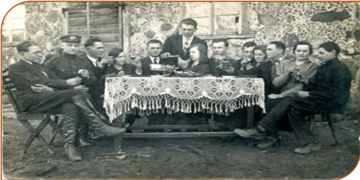
Papilio (Biržų r.) dvaro jaunimas švenčia Velykas. XX a. 4 deš.

Velykų stalą būtinai turėjo puošti margučiai, dažyti svogūnų lukštais ar importiniais dažais, laku. Margučių dažymas dažnai būdavo vaikų ir moterų darbas. Primarginti reikėjo tiek, kad užtektų visiems – ir lauktiems svečiams, ir priklydėliams.