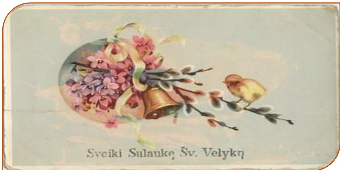
Atvirukas „Sveiki Sulaukė Šv. Velykų“. XX a. 3 deš. – XX a. 4 deš.

Spauda neapsiribojo tik patosu, kritikavo išlaidūniškas miestiečių tradicijas, puošėivas ir atkreipė dėmesį į gausų Velykų stalą, disonuojantį su ekonominės krizės paliestų šeimos biudžetais.