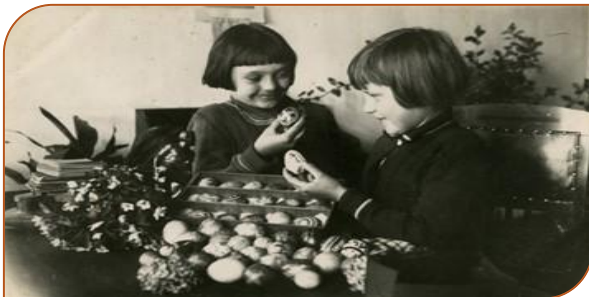
Garliava, Kauno apskr. apie 1936 m.

Prieš Velykas turguose buvo gausiai perkama naminių paukščių, sūrio, kiaušinių, paršiukų ir kt. Iš kaimų į miestus ūkininkai gabeno daug žalumynų – kadagių ir gluosnių, kuriais buvo puošiami stalai. Miesto ponios „Maiste“ užsisakydavo virtų kumpių ir vyniotinių, o „Paramoje“ – tortų ir pyragų. Lietuvos šeimininkės buvo skatinamos išsiversti be užsienietiškų prieskonių ir įvairių importuotų produktų.