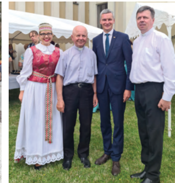
Domeikavos bažnyčios pašventinimo jubiliejaus šventėje su garbiais svečiais.