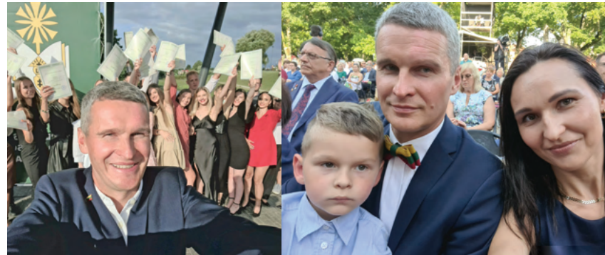
Džiugus susitikimas su Garliavos Jonučių mokyklos abiturientais