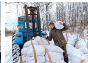
Gelbėjome stirnaites nuo baltojo bado Alšėngirės, Mikailinės, Laibutės miškuose, kviečiau jungtis ir kitus gamtos bičiulius.