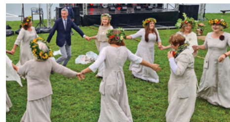
Samylų garsioji šventė „Pėdos marių dugne“ kasmet vis originalesnė.