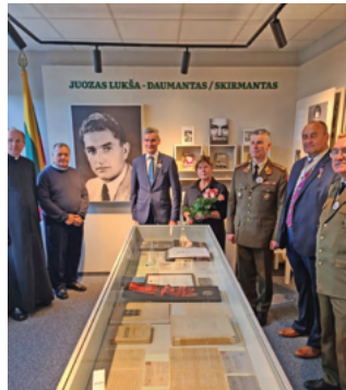
Partizano Juozo Lukšos muziejaus atidarymas