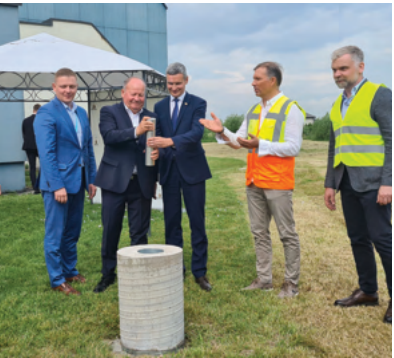
Mastaičių mokyklos statybos ir baseino rekonstrukcijos pradžia

Jaukios akimirkos kartu su bendruomene. Kultūros darbuotojų kūrybiškumo ir entuziazmo išpuoselėtos šventės. Stengiuosi nepraleisti svarbesnių krašto renginių.