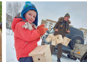
Jau tradicija tapo kelti inkilus grįžtantiems paukščiams. Su šeima ir draugais inkilų įkurdinome Garliavos kaimynystėje ir Mastaičių parkuose.