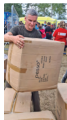
Gerų darbų pavyzdį rodau pats.