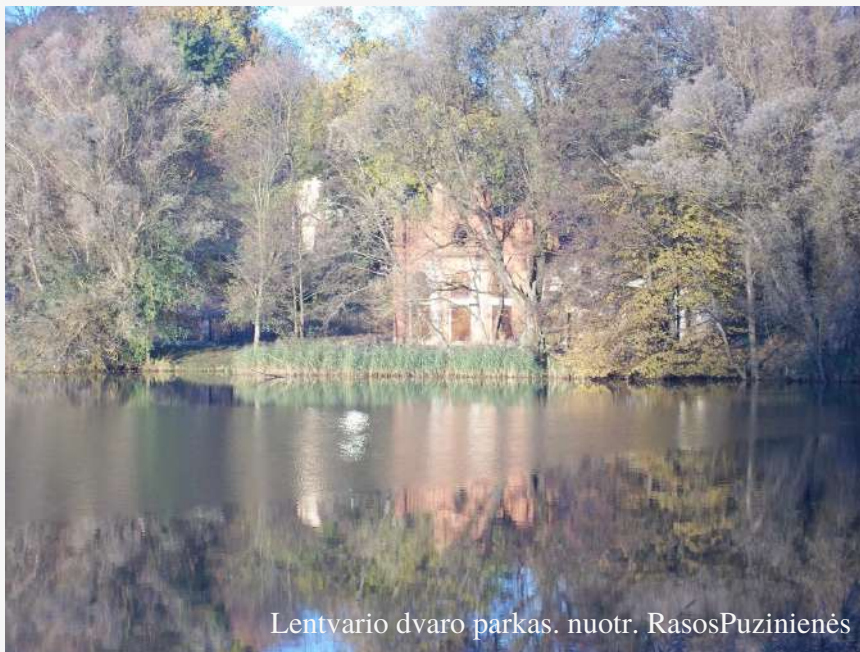
Lentvario dvaro parkas.

Manau, kad šis unikalus grafo Tiškevičiaus parkas tikrai vertas didesnio Valstybės dėmesio.