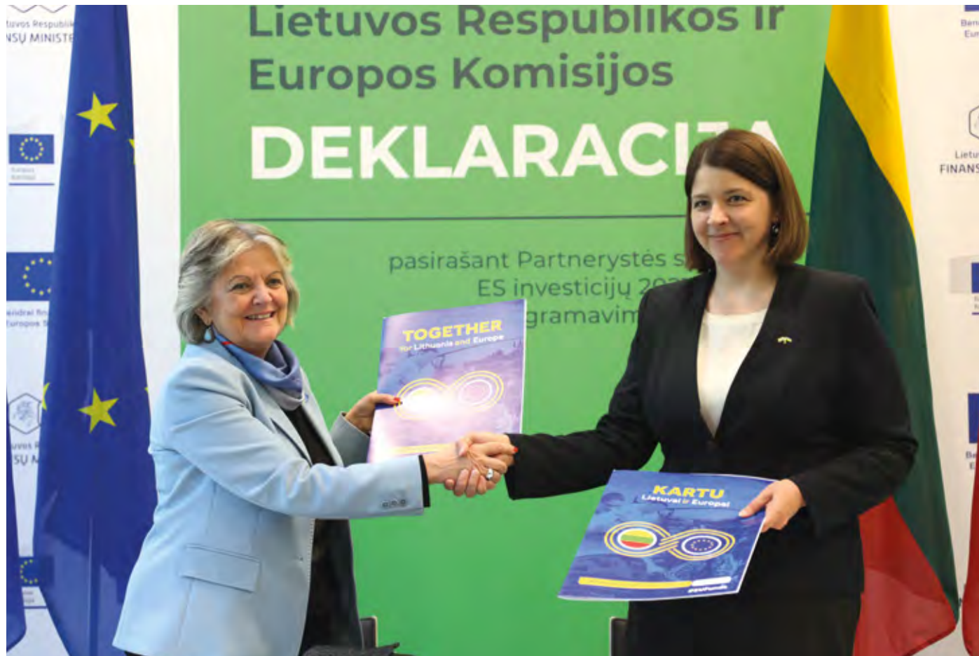
Deklaracijos pasirašymas su Eurokomisare E.Ferreira

Per 2 mlrd. eurų lėšų skirsime regionams patiems planuoti investicijas ir įgalinti bendruomenes tarpusavyje susitarti dėl būtinų projektų. Išskirtinis dėmesys bus skiriamas 10 regioninių centrų Lietuvoje. Tikimasi, kad šių centrų vystymasis duos teigiamą poveikį ir aplinkinėms teritorijoms.