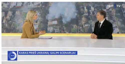
KARAS PRIEŠ UKRAINĄ: GALIMI SCENARIJAI