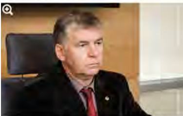
Valdas Rakutis

Valdas Rakutis, TS-LKD frakcijos narys 2022 m. vasaris 4 d. 10:32