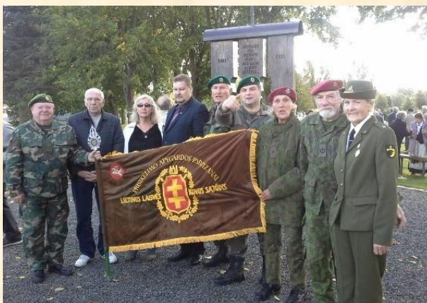
Lietuvos Laisvės Kovos Sąjūdžio atmintis gyva.