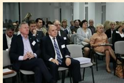
Regionui svarbioje ekonomikos ir verslo konferencijoje.

2017 m. rugsėjo 8 d. – VI mokslinėje-praktinėje konferencijoje „Ekonomika ir verslas: regiono problemos ir galimybės 2017“, kurią organizavo Šiaulių universiteto Ekonomikos katedra. Buvo perskaityti aktualūs pranešimai („Švietimo ir verslo bendradarbiavimas – situacija ir galimybės“, „Pirmųjų metų iššūkiai versle“, „Regioninės politikos įgyvendinimo priemonės. Kodėl jos neduoda laukiamo rezultato“, „Trijų Lietuvos regionų modelis: socioekonominė situacija ir pagrindimas“), vyko Apskritojo stalo diskusija apie Lietuvos savivaldybių fiskalinį konkurencingumą. Konkurencija parodė ne tik Šiaulių universiteto mokslininkų įdirbį, būtinybę kuo skubiau priimti Šiaurės Lietuvos regionui reikalingus sprendimus.