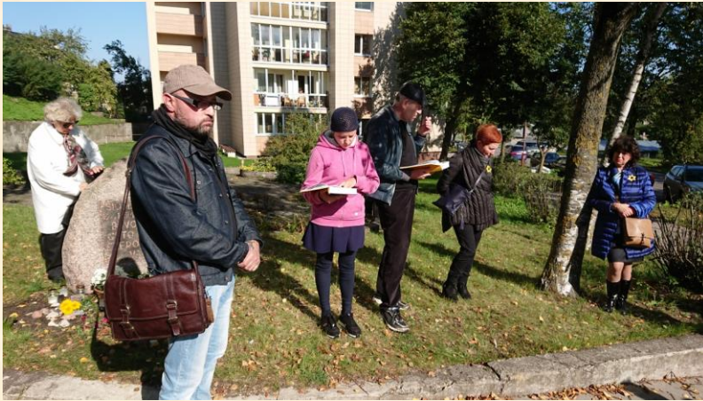
Holokausto aukų VARDŲ skaitymas Šiauliuose.