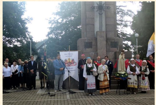
Renginyje pagerbėme katalikiškąją TFP organizaciją.