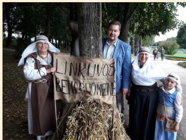
Linkuvos bendruomenė.

2017 m. rugpjūčio 25 d. – Pakruojo miesto šventėje „Žiemgališkas Pakruojis“. Mišios Šv. Jono Krikštytojo bažnyčioje, folkloro ansamblių eiseną ir koncertą Pakruojo parke, regiono folkloro šventė „Žiemgala 2017. Oi, rugeli, žiemkentėli...“, sporto varžybos ir įvairūs konkursai man paliko malonų įspūdį. Žiemgalos tapatybė nuspalvino prasmingą šventę ir atskleidė krašto žmonių dvasinius turtus. Belieka ir toliau juos atrasti, didinti ir skleisti visai Lietuvai.