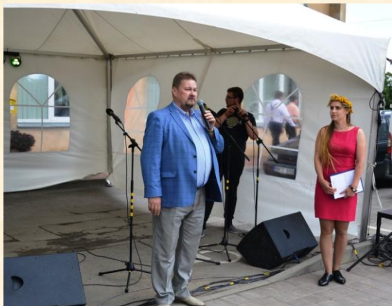
Visada malonu tarmiškai pasveikinti kraštiečius.

nes jos leidžia pabendrauti, pailsėti nuo darbų ir rūpesčių. Taip stiprėja bendruomenės, tvirtėja žmonių tarpusavio ryšiai.