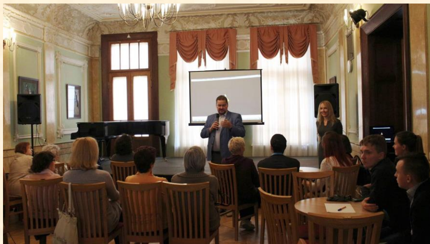
Miniu Europos žydų kultūros dieną Šiauliuose.

2017 m. rugsėjo 3 d. lankiausi Chaimo Frenkelio viloje, kur buvo minima Europos žydų kultūros diena. Buvo įdomu pamatyti videofilmus, supažindinančius su žydų tautos ir bendruomenių istorija. Buvo parodytas ir premjerinis filmas „Žydai Šiauliuose“, pristatantis dabartinę Šiaulių miesto žydų bendruomenę. Sveikinimo kalboje minėjau, kad žydų istorija – tai įpareigojimas politikams ir visiems žmonėms priimti apgalvotus, išmintingus sprendimus.