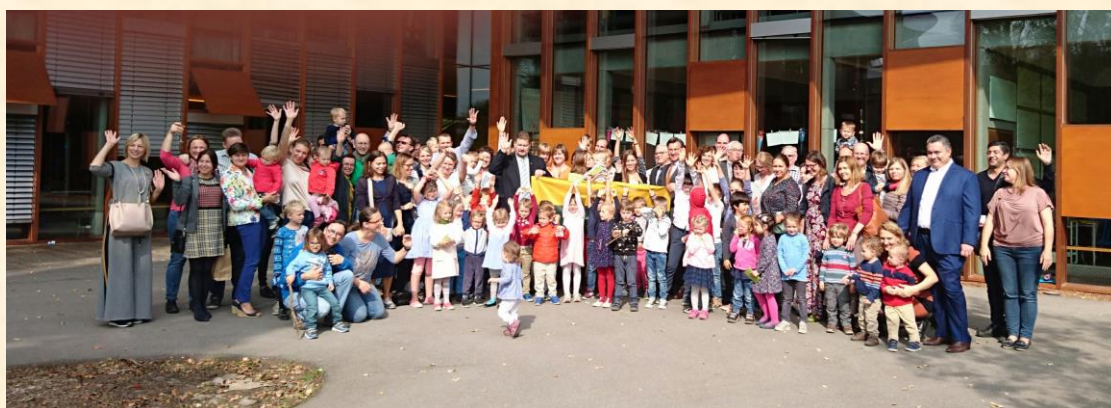
Liuksemburgo lituanistinės mokyklos šventėje.