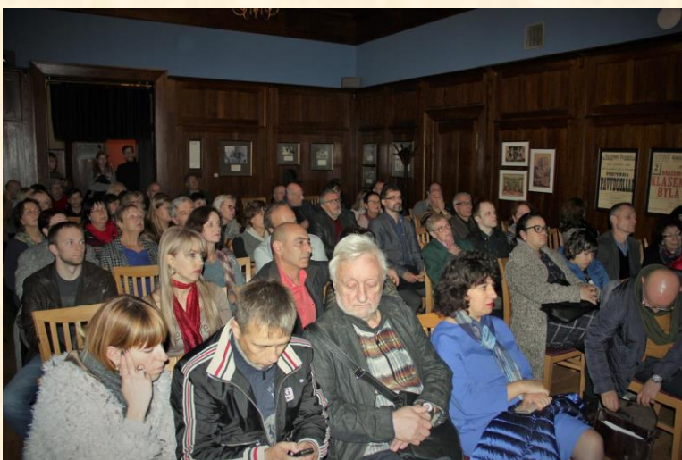
Dokumentinio filmo „Paskutinis rugpjūčio sekmadienis“ pristatymas.