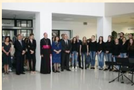
Mokslo ir žinių diena 20-metį švenčiančiame Šiaulių universitete.