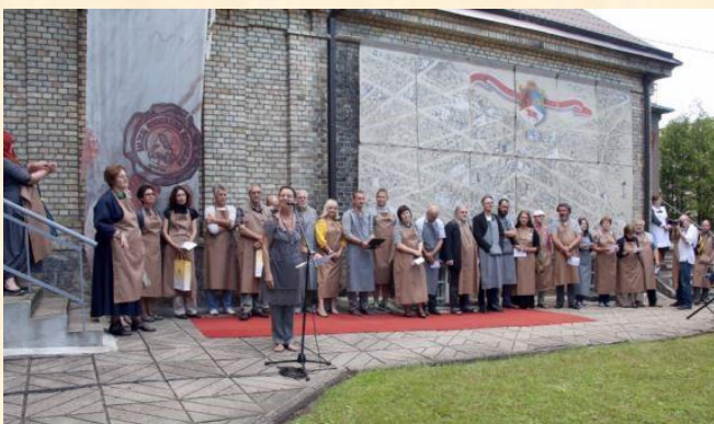
Žaismingas ir originalus festivalio atidarymas.