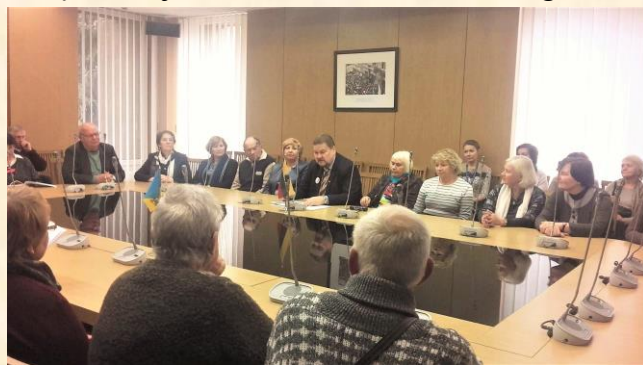
Seime kalbuosi su Šiaulių Trečiojo amžiaus universiteto studentais.

2017 m. spalio 24 d. Seime susitikau su Šiaulių Trečiojo amžiaus universiteto Žmogaus ir socialinės aplinkos pažinimo fakulteto studentais. Svečiai buvo supažindinti su Seimu, diskutavome apie esmines žmonių ir valstybės problemas, apsikeitėme įvairiomis nuomonėmis. Deja, mano pateikta statistika ir LVŽS pastangos, kad 2017–2018 metais pensijos didėja per 63 eurų, nelabai nudžiugino svečius, nes kainos, kurias diktuoja tikrai ne Seimas, kyla dar greičiau... Ačiū Šiaulių senjorams už dėmesį Seimui, pamokas ir nuotaikas.