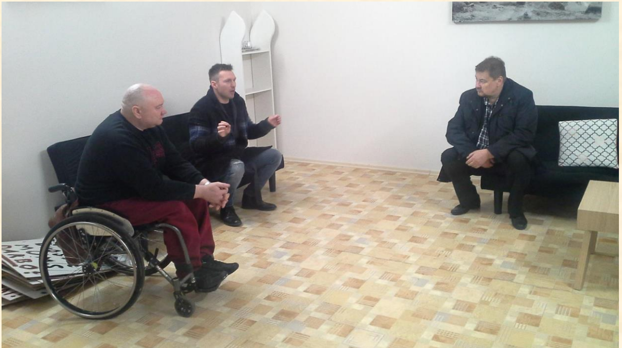
Bendrauju su socialinės įmonės „Hestas“ darbuotojais.