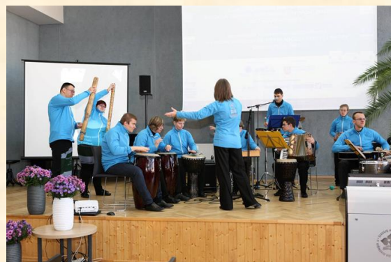
Tarptautinėje mokslinėje-praktinėje konferencijoje „Neįgalus žmogus: visuomenėje, šeimoje, bibliotekoje“ aptarti neįgalių asmenų integracijos klausimai.