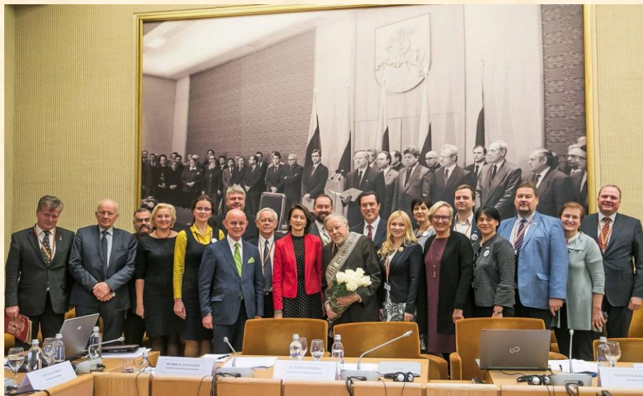
Seimo ir Pasaulio lietuvių bendruomenės komisijos nariai su prof. Vytautu Landsbergiu.

2017 m. spalio 24 d. Seime susitikau su Šiaulių Trečiojo amžiaus universiteto Žmogaus ir socialinės aplinkos pažinimo fakulteto studentais. Svečiai buvo supažindinti su Seimu, diskutavome apie esmines žmonių ir valstybės problemas, apsikeitėme įvairiomis nuomonėmis. Deja, mano pateikta statistika ir LVŽS pastangos, kad 2017–2018 metais pensijos didėja per 63 eurų, nelabai nudžiugino svečius, nes kainos, kurias diktuoja tikrai ne Seimas, kyla dar greičiau... Ačiū Šiaulių senjorams už dėmesį Seimui, pamokas ir nuotaikas.