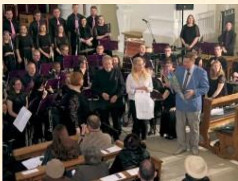
Dėkoju muzikantams ir jų vadovams.

2017 m. spalio 20 d. – Šiaulių arenos 10 metų minėjimo šventėje „ŠIAULIŲ ARENAI – 10 METŲ!“. Jubiliejinis koncertas tik patvirtino, kad „Šiaulių arena“ yra Šiaurės Lietuvos kultūros, meno ir sporto centras. Renginyje aš įteikiau Seimo Šiaulių krašto bičiulių padėką.