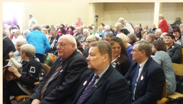
Šiaulių Parkinsono draugijos šventėje.