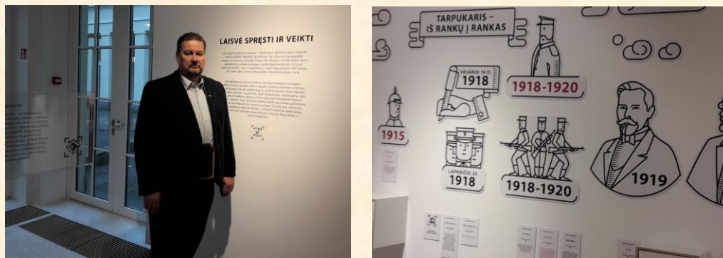
Lankausi Valstybės pažinimo centre.

susipažinti su Valstybės pažinimo centru, reikia iš anksto užsiregistruoti. Kontaktai: Totorių g. 28, Vilnius; mob. 8 706 64094; vpc@prezidentas.lt; www.pazinkvalstybe.lt .