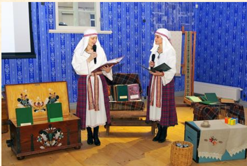
Renginio vedėjos atskleidė bibliotekos turis.