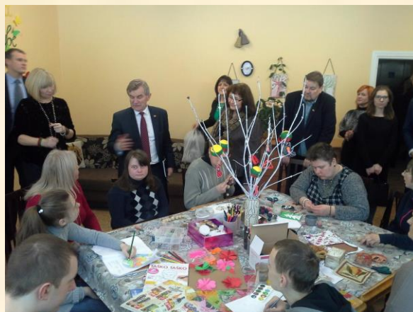
Ugdymo centro auklėtiniai laukia visuomenės dėmesio.