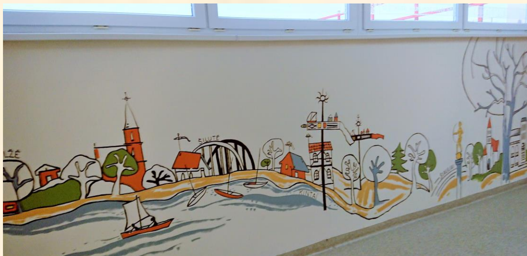
Gegužių progimnazijoje atidaryta Vydūno alėja.

N. Brazauskas 2018-01-09 regioniniame Šiaulių apskrities ir miesto dienraštyje „Šiaulių kraštas“ publikavo straipsnį „Naujųjų (anti)herojų beieškant“ (plačiau: http://www.skrastas.lt/?rub_sav=1144871155&id=1515428009&pried=2018-01-09 ); 2018-01-16 dalyvavo kvalifikacijos tobulinimo seminare „Kūrybiškumo skatinimas ir problemų sprendimas kitaip“; 2018-01-25 – respublikinėje metodinėje-praktinėje konferencijoje „Visuminis ugdymas: akademinio ir dorovinio ugdymo pusiausvyros svarba švietime“ Šiaulių Gegužių progimnazijoje.