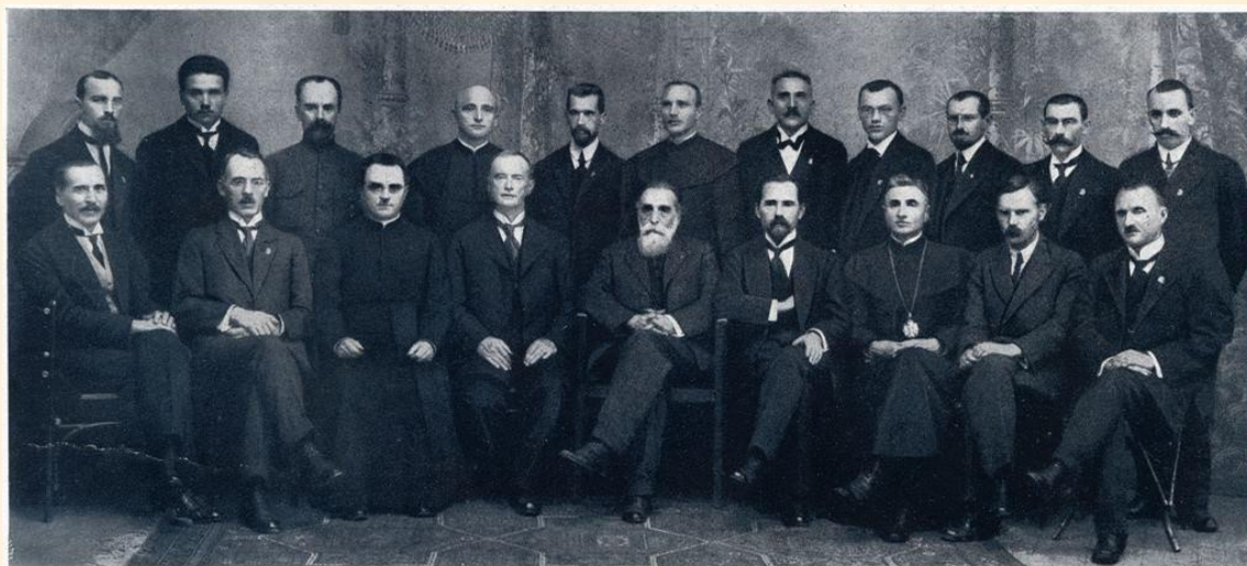
Lietuvos Taryba, pasirašiusi 1918 m. vasario 16 d. valstybės Nepriklausomybės atkūrimo aktą. Iš kairės sėdi: Jonas Vileišis, Jurgis Šaulys, Justinas Staugaitis, Stanislovas Narutavičius, Jonas Basanavičius, Antanas Smetona, Kazimieras Šaulys, Steponas Kairys, Jonas Smilgevičius; iš kairės stovi: Kazimieras Bizauskas, Jonas Vailokaitis, Donatas Malinauskas, Vladas Mironas, Mykolas Biržiška, Alfonsas Petrulis, Saliamonas Banaitis, Petras Klimas, Aleksandras Stulginskis, Jokūbas Šernas, Pranas Dovydaitis. Vilnius, 1918 m. vasario mėn.