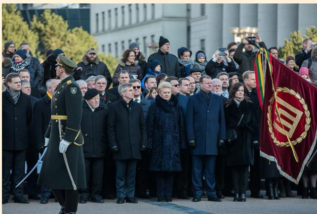
Iškilminga vėliavos pakėlimo ceremonija Nepriklausomybės aikštėje prie Seimo.