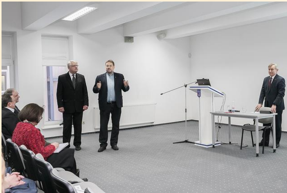
Seimo Pirmininkas V. Pranckietis ištesėjo pažadą ir perskaitė paskaitą.

Kviečiu Jus susipažinti su Šiaulių trečiojo amžiaus universitetu: https://www.siauliai.lt/Tre%C4%8Diojo%20am%C5%BEiaus%20universitetas315 .