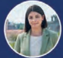
Finansų ministrė Gintarė Skaistė

Nesiblaškėme ir tas duoda vaisių, pvz., krašto apsaugos finansavimas per kadenciją užaugo nuo 1 mlrd. eurų iki 2 mlrd. eurų, ženkliai padidintas viešojo sektoriaus darbuotojų darbo užmokestis, pensijos. Šie skaičiai ne tik rodo mūsų tvirtą įsipareigojimą auginti ir stiprinti Lietuvą, bet ir užtikrina žmonių gerovės augimą“.