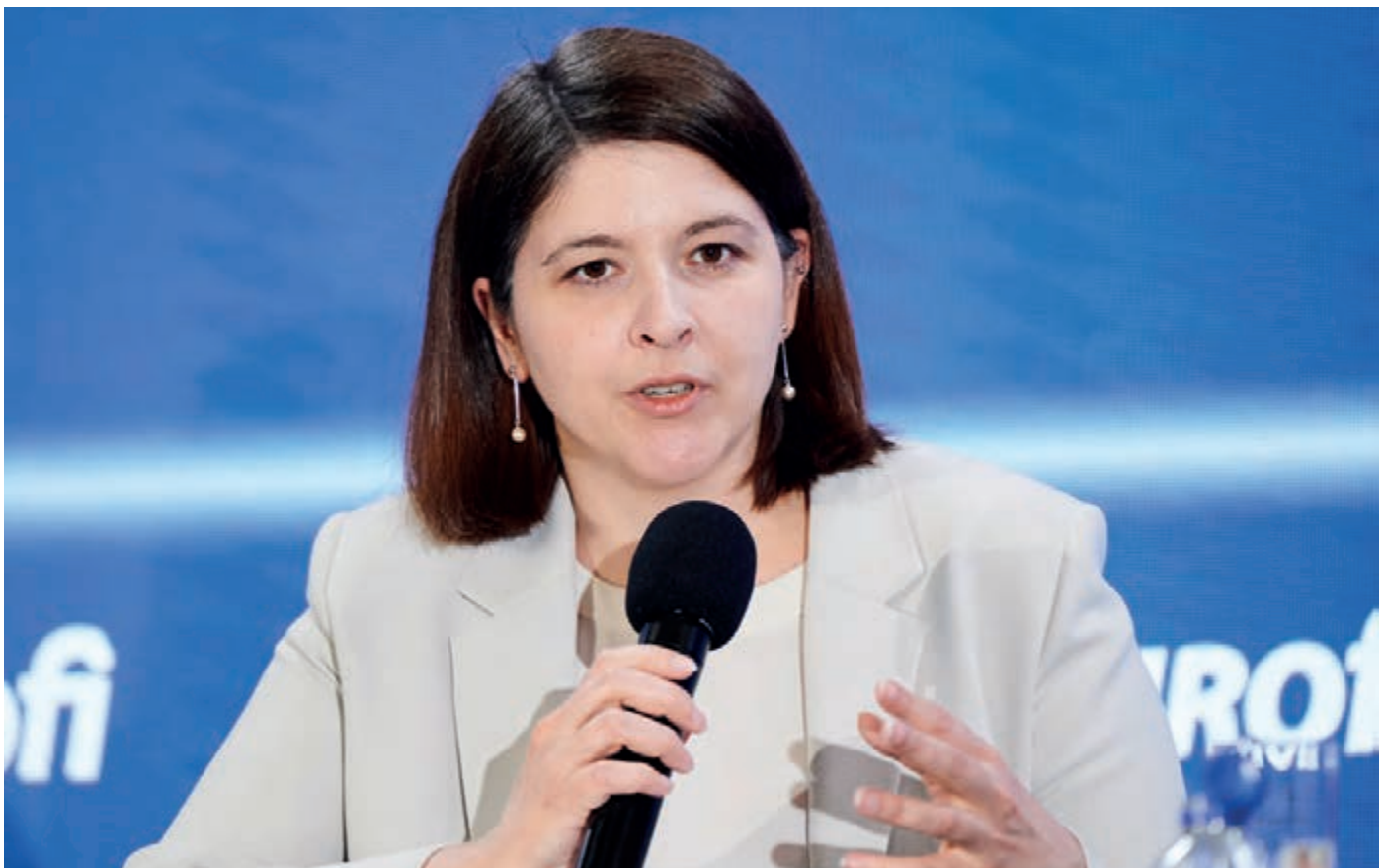
Ministrė Ginte (Belgija) dalyvavo finansų forumo EUROFI diskusijoje