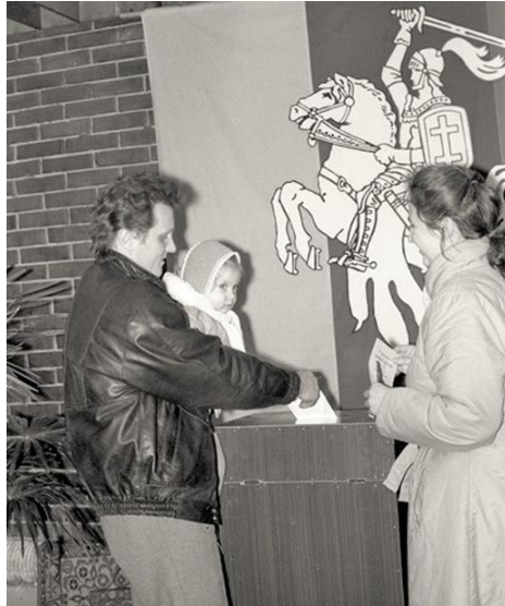
Rinkimai 1990 m. vasario 24 d.

1990 m. vasario 24 d. triuškinamą pergalę pasiekė Sąjūdžio remti kandidatai, žadėję „atkurti Nepriklausomą, demokratiškai tvarkomą Lietuvos valstybę“. Rinkimuose balsavo 1 mln. 851 tūkst. rinkėjų, tai sudarė 71,72 proc. visų balsavimo teisę turėjusių rinkėjų. Iš 90-ies tą dieną išrinktų deputatų 72 buvo remiami Sąjūdžio, 14 išrinktų deputatų – savarankiškosios Lietuvos komunistų partijos atstovai, 4 – LKP (TSKP) atstovai. Po antrojo rinkimų turo paaiškėjo, kad Sąjūdžio kandidatai laimėjo 102 iš 133 mandatų. Sąjūdžio pergalė rinkimuose buvo akivaizdi.