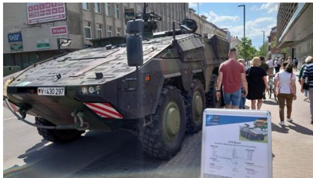
Lietuvos visuomenė pasitiki Lietuvos kariuomene ir NATO.