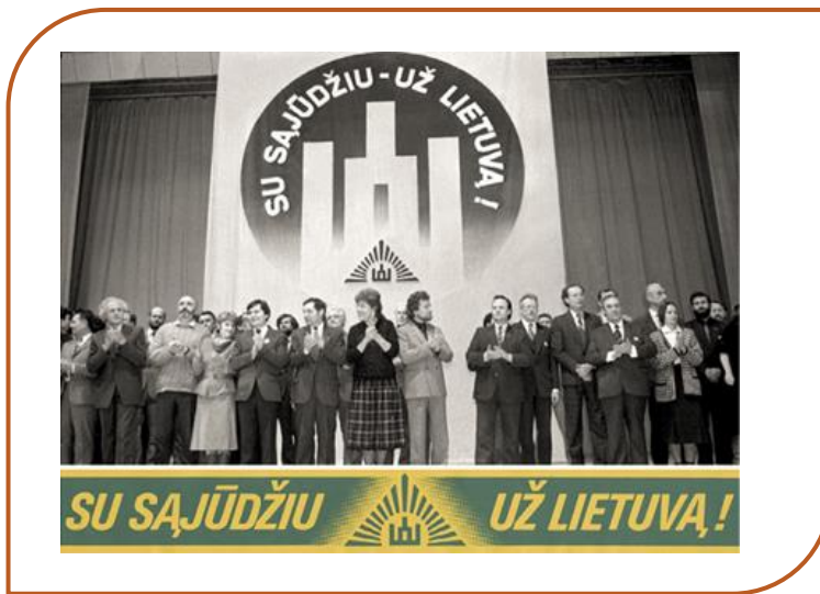
Sąjūdžio remiami kandidatai į Aukščiausiąją Tarybą.

Svarbiausias įvykis Lietuvos politiniame gyvenime – 1990 m. pradžioje vykę rinkimai į Lietuvos SSR Aukščiausiąją Tarybą. Juose susirungė dvi pagrindinės politinės jėgos: Sąjūdis ir tuomet jau savarankiška Lietuvos komunistų partija (LKP). Kiekvienam miestui ir rajonui buvo sudaryta galimybė turėti savo atstovą Lietuvos Aukščiausioje Taryboje, kad būtų galima ginti rajono žmonių interesus ir realizuoti savo pagrindines idėjas, o svarbiausia – siekti Nepriklausomybės.