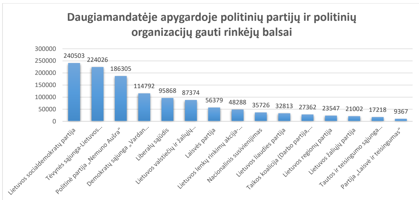
1 pav. Daugiamandatėje apygardoje politinių partijų ir politinių organizacijų gauti rinkėjų balsai