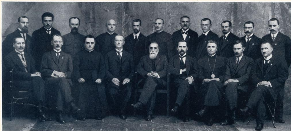
Lietuvos Taryba, pasirašiusi 1918 m. vasario 16 d. valstybės Nepriklausomybės atkūrimo aktą. Iš kairės sėdi: Jonas Vileišis, Jurgis Šaulys, Justinas Staugaitis, Stanislovas Narutavičius, Jonas Basanavičius, Antanas Smetona, Kazimieras Šaulys, Steponas Kairys, Jonas Smilgevičius; iš kairės stovi: Kazimieras Bizauskas, Jonas Vailokaitis, Donatas Malinauskas, Vladas Mironas, Mykolas Biržiška, Alfonsas Petrulis, Saliamonas Banaitis, Petras Klimas, Aleksandras Stulginskis, Jokūbas Šernas, Pranas Dovydaitis. Vilnius, 1918 m. vasario mėn.