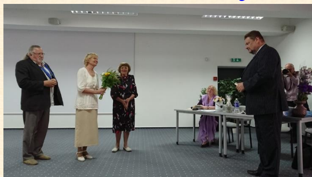
Dalijusi savo mintimis su „Tekstų skaitymų“ dalyviais.