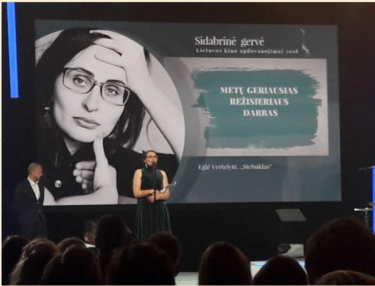
„Sidabrinė gervė“ režisierės E. Vertelytės dėka atskris ir į Šiaulius.