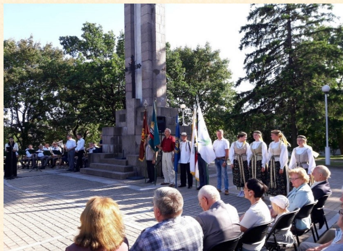
Baltijos kelio minėjimas Šiauliuose.

Ne pirmą kartą dalyvavau ir Šiaulių Sukilėlių kalnelyje vykusiame šventiniame renginyje. Nežinau, kaip Jums, bet man rugpjūčio 23-oji visada palieka dvejopą išpūdį ir labai skirtingas emocijas. Tą dieną visada prisimenu KELIO metaforą. Kelias gali būti (ir yra) žmogaus, jo likimo ženklas, pagaliau tai ir tautos likimo, pasirinkimo simbolis. Ši metafora mane paskatino parašyti publicistinį straipsnį „Kelias – nesibaigiantis procesas“, su kuriuo galite susipažinti šio naujienlaiškio rubrikoje „Žiniasklaida“.