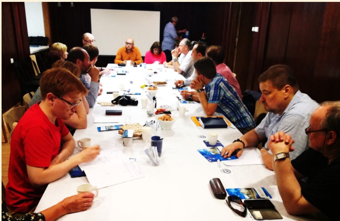
Diskusija Šiaulių žydų įamžinimo klausimais buvo įdomi ir reikalinga.