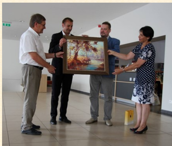
Paveikslo perdavimo ceremonijos Vilniuje ir Šiauliuose.