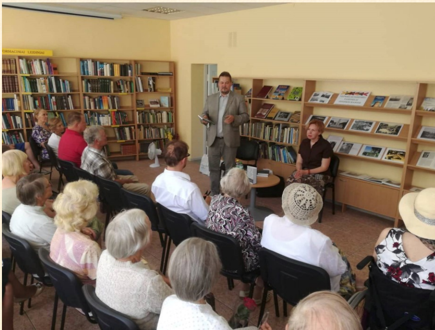
Bendrauti su Jonišchio krašto žiemgaliais visada malonu ir prasminga.