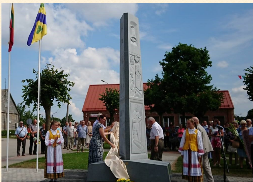
Linkuvą atlaidų metu papuošė paminklas „Linkuvai ir linkuviams“.