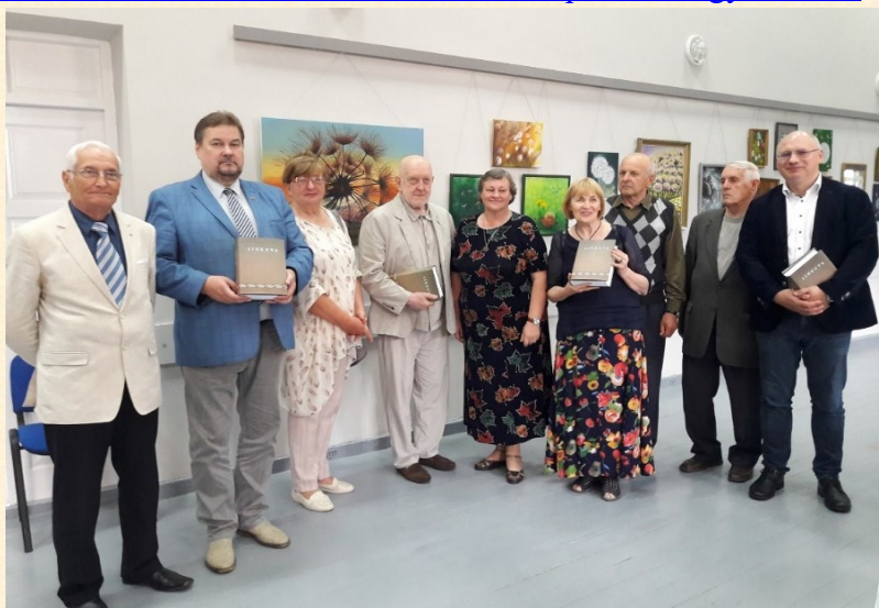
„Linkuva“ – šimtmečio dovana ir linkuviams, ir Lietuvai.