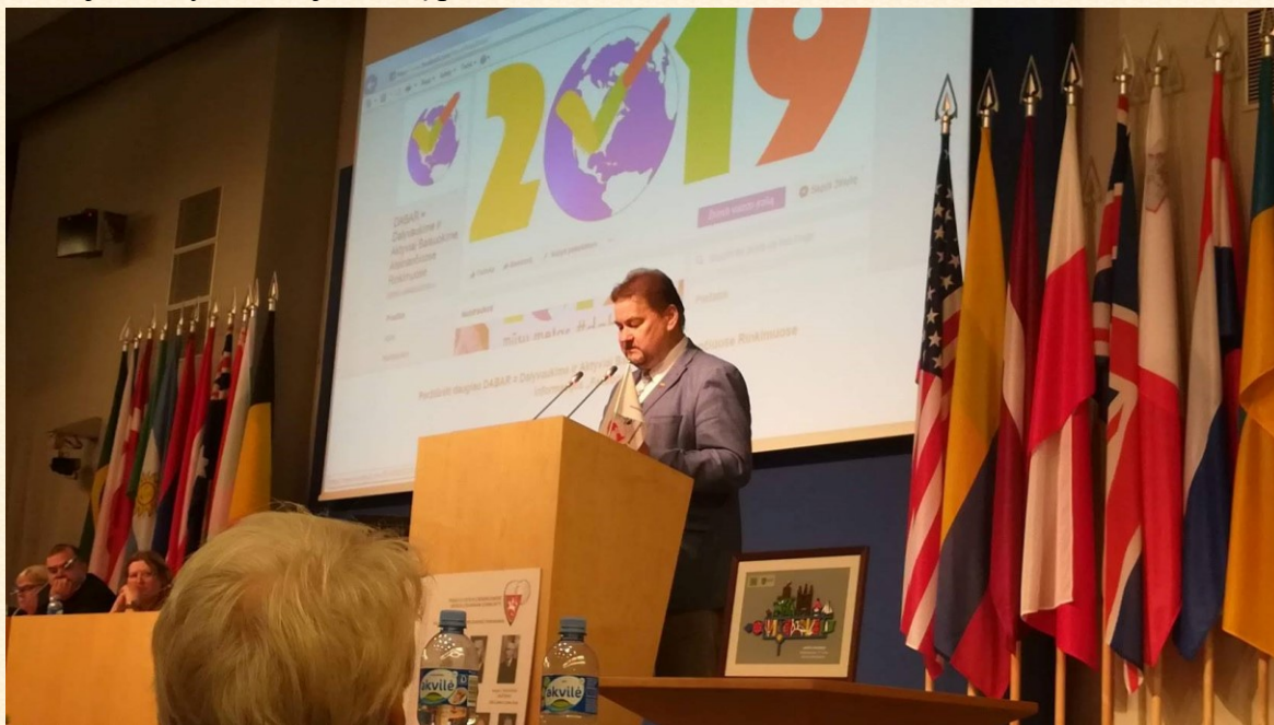
Skaitau pranešimą Pasaulio lietuvių bendruomenės XVI Seime.