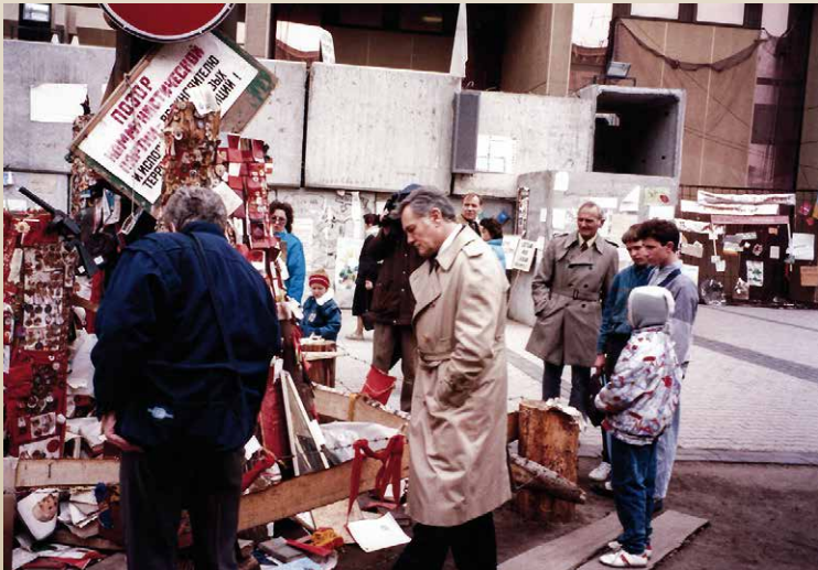
Valdas Adamkus apžiūri barikadas prie Lietuvos Respublikos Aukščiausiosios Tarybos Vilnius, 1991 m. gegužės 1 d.