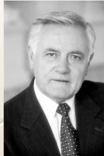
Lietuvos Respublikos Prezidentas Valdas Adamkus Vilnius, 2000 m. rugsėjo 2 d.

Žmonės, kurie augo, brenė, formavosi kartu su jauna Lietuvos valstybe. Karta, kuri suprato, kad Lietuva – tai mūsų dvasios namai, todėl mes turime juos ginti, puoselėti ir saugoti. Ne vienas iš mūsų tai darydamas padėjo galvą... Tada dabar jaučiuosi tarsi kalbėdamas ir už savo draugus, už tuos, kurių jau nėra su mumis. Kurie žuvo pokario mėsmaalėje, užgeso tremtyje ar emigracijoje, tačiau iki pat pabaigos tikėjo laisva Lietuva. Dabar galiu patvirtinti tai, ką sakiau ne sykį: tik laisvė leidžia gyventi visavertį normalų žmogaus gyvenimą. Mes gyvenime nuolat turime alternatyvų, kai renkamės profesiją, draugus, gyvenamąją vietą. Bet alternatyvos laisvei nėra.