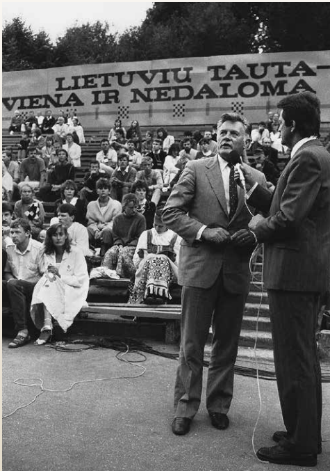
Valdas Adamkus duoda interviu viename iš laisvės mitingų Kaunas, 1989 m. liepos mėn.