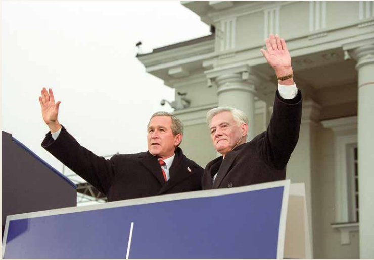
Jungtinių Amerikos Valstijų Prezidento Džordžo Volkerio Bušo susitikimas su Lietuvos visuomene Rotušės aikštėje Vilnius, 2002 m. lapkričio 23 d.