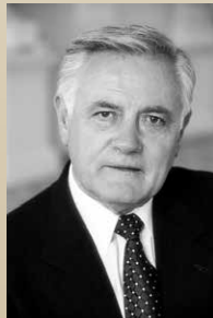
Valdas Adamkus (2016 m.)