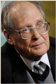
Sergejus Kovaliovas (2011 m.)

2016 metų Laisvės premija paskirta Aukščiausiosios Tarybos-Atkuriamojo Seimo Pirmininkui, pirmajam atkurtos Lietuvos valstybės vadovui, Lietuvos Nepriklausomybės Akto signatarui Vytautui LANDSBERGIUI.