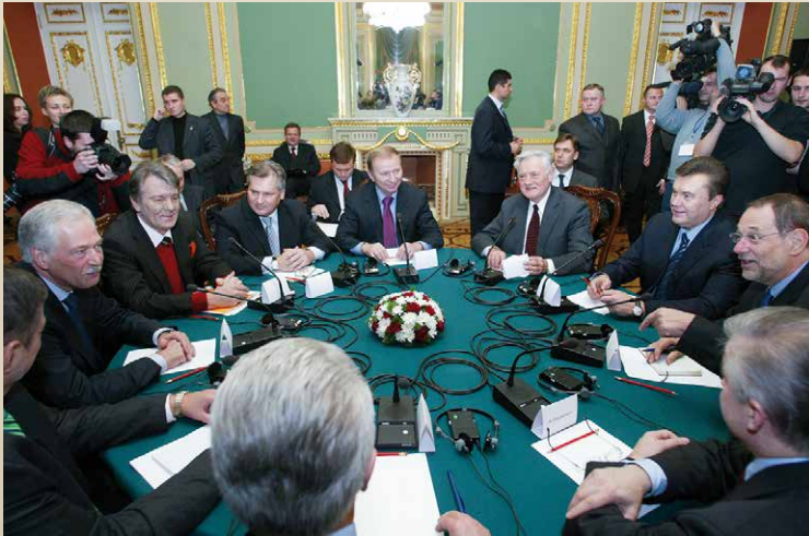
Prie derybų stalo Ukrainoje ieškant išeities iš politinės aklovietės. Iš kairės: kandidatas į Ukrainos prezidentus Oranžinės revoliucijos lyderis Viktoras Juščenka, Lenkijos Prezidentas Aleksandras Kvašnievskis, Ukrainos Prezidentas Leonidas Kučma, Lietuvos Prezidentas Valdas Adamkus, kandidatas į Ukrainos prezidentus Viktoras Janukovyčius, Europos Sąjungos Tarybos generalinis sekretorius Chavjeras Solana Kijevas, 2004 m. gruodžio 6 d.

dentavimo pasiekimų yra į Europą grįžtančios Lietuvos europietiškos reputacijos atstatymas. Valdas Adamkus dažnai apibūdinamas kaip vakarietiškas prezidentas, grąžinęs savo šalį į jos vakarietišką kontekstą. Valdo Adamkaus vakarietiška laikysena reprezentavo visos Lietuvos vakarietišką laikyseną. Pagrindinis V. Adamkaus vykdytos užsienio politikos bruožas buvo įsitikinimas, kad politikai privalo paisyti esminių tarptautinės teisės principų: pagarbos žmogaus teisėms, valstybių suverenumui, šalies teritorijos vientisumui.