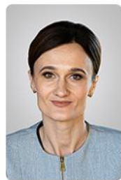
Viktorija ČMILYTĖ- NIELSEN