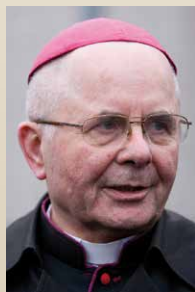
Sigitas Tamkevičius SJ (2013 m.)