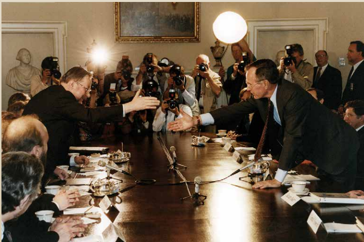
Trijų Baltijos valstybių vadovų – Vytauto Landsbergio, Ivaro Guodmanio ir Edgaro Savissaro vizitas JAV Baltuosiuose rūmuose. Jungtinių Amerikos Valstijų Prezidentas Džordžas Bušas sveikina Lietuvos vadovą Vytautą Landsbergį Vašingtonas, 1991 m. gegužės 8 d.

2003–2004 m. Vytautas Landsbergis buvo ir Europos Parlamento stebėtojas, o 2004–2014 m. – visateisiu Europos Parlamento narys. Vytautas Landsbergis buvo Europos Parlamento Europos liaudies partijos (krikščionių demokratų) grupės narys, šios grupės biuro narys, Užsienio reikalų komiteto bei Saugumo ir gynybos pakomitečio narys, Teisės reikalų komiteto pavaduojantis narys, Europos Parlamento Pietų Kaukazo delegacijos vicepirmininkas.