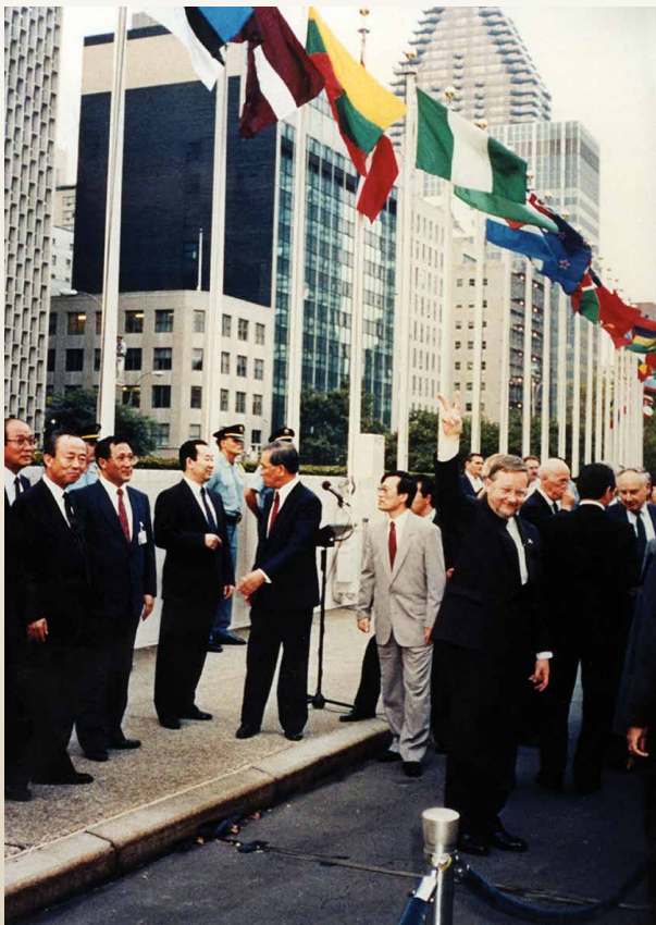
Lietuva priimta į Jungtinių Tautų Organizaciją! Pirmojo atkurtos Lietuvos valstybės vadovo, Aukščiausiosios Tarybos-Atkuriamojo Seimo Pirmininko Vytauto Landsbergio pergalės gestas iškilmingai iškėlus Lietuvos valstybės vėliavą Niujorkas, 1991 m. rugsėjo 17 d.

kofonijos Plejados ordinas; 2001 m. – Latvijos Respublikos Trijų Žvaigždžių (2 laipsnio) ordinas; 2002 m. – Estijos Respublikos Marijos žemės kryžiaus I laipsnio ordinas; 2003 m. – Vokietijos Federacinės Respublikos Saksonijos žemės parlamento Konstitucinis medalis; 2005 m. – Roberto Schumano medalis; 2007 m. – Karolio IV Europos medalis; 2008 m. – Nyderlandų karalystės Orange-Nasau riterio Didysis Kryžius; 2009 m. Gruzijos Šv. Georgijaus ordinas; 2016 m – Prancūzijos Garbės legiono ordino Didysis kryžius.