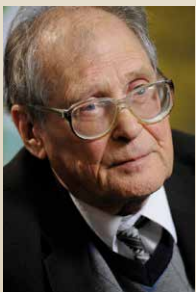
Sergejus Kovaliovas (2011 m.)

2016 metų Laisvės premija paskirta Aukščiausiosios Tarybos-Atkuriamojo Seimo Pirmininkui, pirmajam atkurtos Lietuvos valstybės vadovui, Lietuvos Nepriklausomybės Akto signatarui Vytautui LANDSBERGIUI.