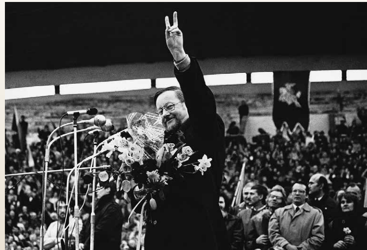
Pirmasis atkurtos Lietuvos valstybės vadovas, Aukščiausiosios Tarybos-Atkuriamojo Seimo Pirmininkas Vytautas Landsbergis Vingio parke įvykusiame mitingame Nepriklausomybei įtvirtinti. Apie 300 tūkstančių susirinkusiųjų pareiškė savo ryžtą eiti Lietuvos Nepriklausomybės keliu Vilnius, 1990 m. balandžio 7 d.