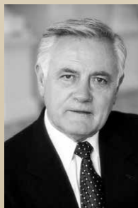
Valdas Adamkus (2016 m.)