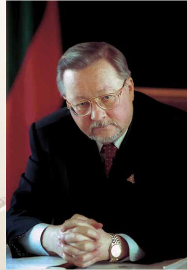
Pirmasis atkurtos nepriklausomos Lietuvos valstybės vadovas, Aukščiausiosios Tarybos-Atkuriamojo Seimo Pirmininkas Vytautas Landsbergis Vilnius, 1997 m. kovo mėn.

Mes buvome laisvi jau tada, kai kilo Sąjūdis, kai pajutome savyje dvasinį bendrumą, kad mūsų tiek daug ir mes nebijome. Pasijutom laisvi jau tada, kai išsirinkome savo tikrą parlamentą, paskelbėme Nepriklausomybę, nes tikėjome ja ir ją kurdami gyvenome kaip laisvi žmonės, kaip nepriklausoma valstybė.