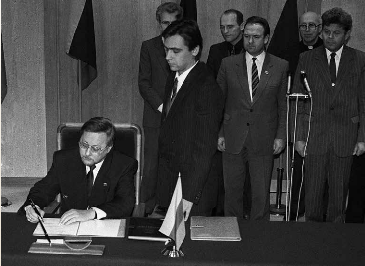
Aukščiausiosios Tarybos-Atkuriamojo Seimo Prezidiumo posėdžių salėje (dabar Konstitucijos salė) Lietuvos Respublikos Konstituciją pasirašo pirmasis atkurtos Lietuvos valstybės vadovas, Aukščiausiosios Tarybos-Atkuriamojo Seimo Pirmininkas Vytautas Landsbergis Vilnius, 1992 m. lapkričio 6 d.