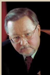
Vytautas Landsbergis (2016 m.)