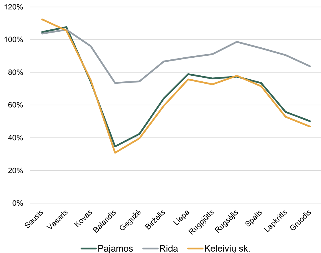
2020/2019 rodiklių lygis, proc.